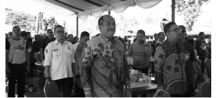
Wakil Bupati Asahan mengikuti secara langsung pembukaan Bukit Barisan Expo 2023

"Atas nama pribadi dan Pemerintah Kabupaten Asahan, kami memberikan apresiasi setinggi-tingginya kepada jajaran TNI atas kerja keras dan sumbangsihnya dalam menjaga kedaulatan negara. Tentu saja kami sangat menyambut baik serta mendukung sepenuhnya pelaksanaan kegiatan expo ini. Karena selain masyarakat bisa mengetahui alutsista TNI, dengan adanya pameran terse-