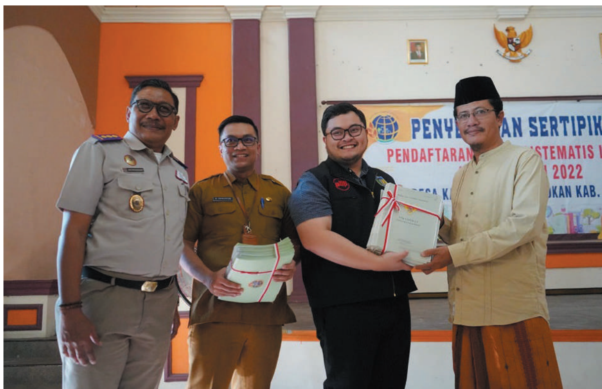
Mas Dhito saat menyerahkan sertifikat tanah kepada ratusan warga di Desa Kalirong, Kecamatan Tarokan

Kab. Kediri, SMN - Bupati Kediri Hanindhito Himawan Pramana meminta masyarakat penerima sertifikat tanah dari program Pendaftaran Tanah Sistematis Lengkap (PTSL) untuk berhati-hati dengan rentenir.