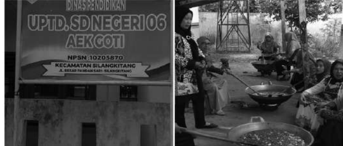
UPTD SDN 06 gelar kegiatan baca ayat- ayat Suci Al-Qur'an menyambut 10 Muharram