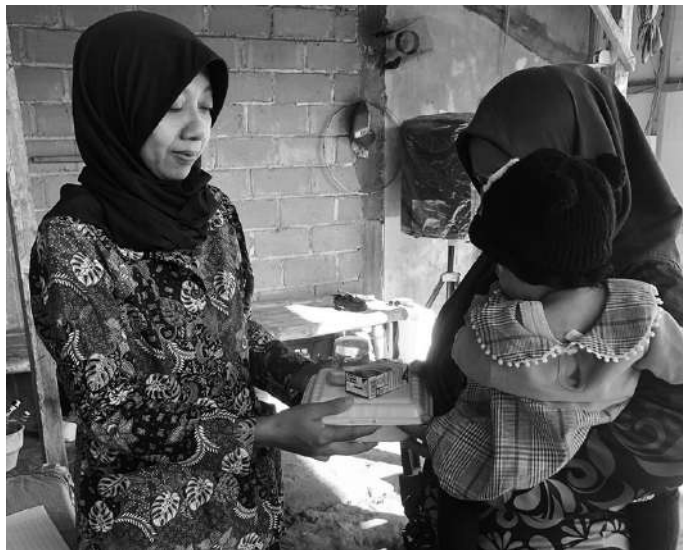
Kegiatan posyandu di Desa Rejoso dengan pemberian makanan tambahan

san kepada masyarakat supaya anaknya terhindar dari stunting, selama hamil harus selalu dirawat juga dipantau melalui pemeriksaan dini, juga makan makanan yang bergizi, sehingga itu akan menjamin kesehatan ja-