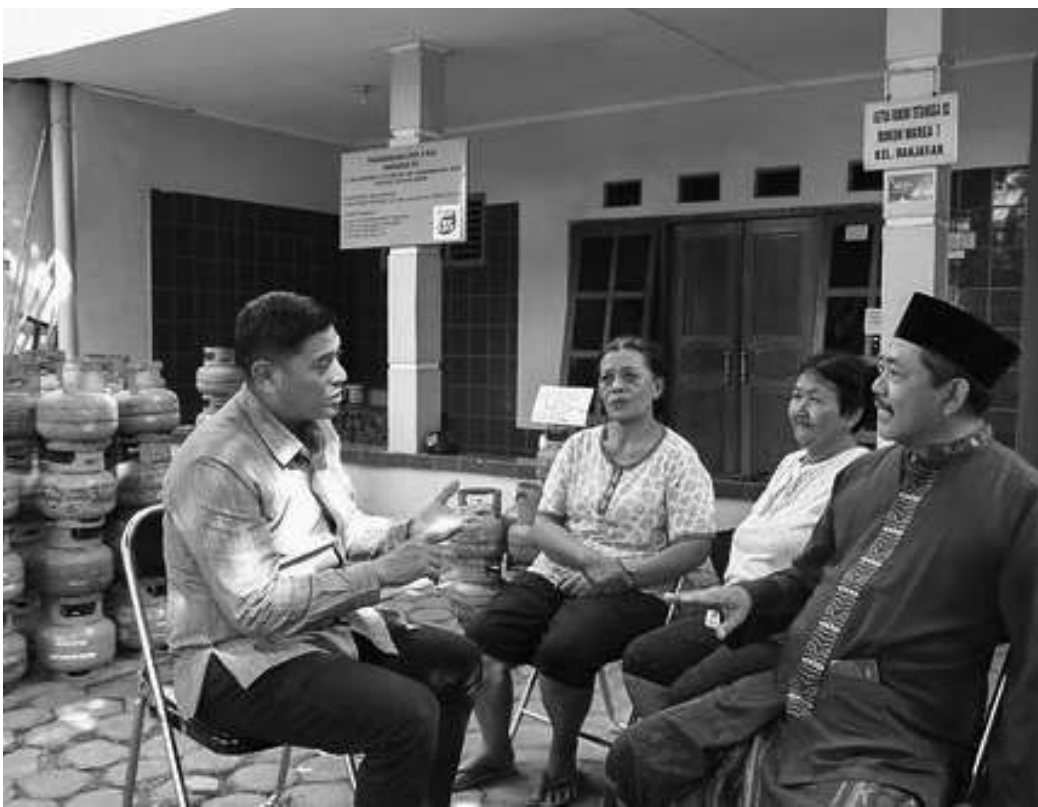
Wali Kota Kediri Abdullah Abu Bakar mengimbau agar masyarakat tidak melakukan pembelian yang berlebihan atau panic buying