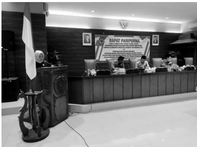
Suasana Rapat Paripurna DPRD Kabupaten Nganjuk bersama Bupati Nganjuk

Nganjuk, SMN - Selasa (18/7/2023) bertempat di Ruang Utama (Ruang Rapat Paripurna) gedung Dewan Perwakilan Rakyat Daerah (DPRD) Ka-