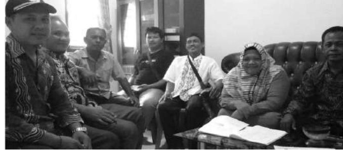
BPD gelar rapat internal terkait Pengusulan Pj.Kades Mandalasena