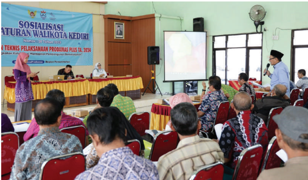
Suasana sosialisasi Peraturan Walikota Kediri Nomor 28 Tahun 2023 tentang Pedoman Teknis Pelaksanaan Program Pemberdayaan Masyarakat Plus Tahun Anggaran 2024 di Gedung Serba Guna Kelurahan Dermo, Jum'at (28/7).