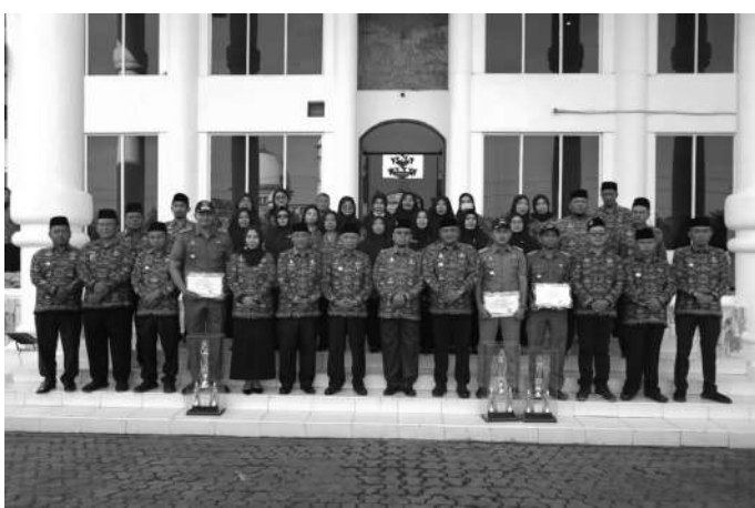
Sekretaris Daerah Kabupaten Asahan memimpin upacara Hari Kesadaran Nasional

Untuk penghargaan kepada Kelurahan terbaik diberikan kepada Kelurahan Selawan sebagai terbaik I, Kelurahan Sei Rengas sebagai terbaik II, dan Kelurahan Mutiara sebagai terbaik III. Sementara untuk Desa terbaik, Desa Rawang Lama sebagai terbaik I, terbaik II Desa Silo Bonto dan terbaik III Desa Hessa Air Genting. Kemudian