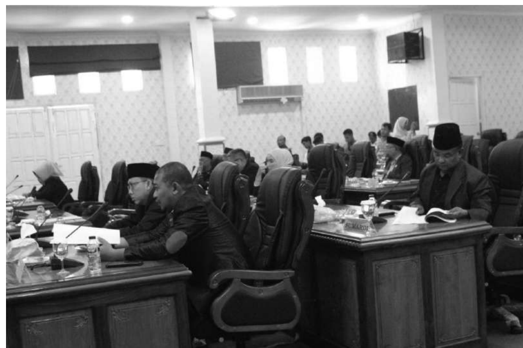
Anggota DPRD saat mengikuti Paripurna Pansus Raperda Pajak dan Retribusi Daerah