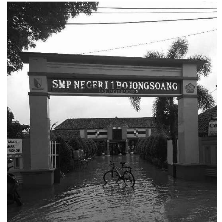
SMP NEGERI 1 BOJONGSOANG

Kesempatan dan peluang pengembangan pembangunan di wilayah Desa Tegalluar yang merupakan Desa tempat SMPN 1 Bojongsoang berlokasi dan beroperasi, jelas ditangkap sebagai peluang positif dan menjadi kekuatan sekolah, sehingga hal ini menjadi bagian indikator yang dipakai dalam daftasi penerapan sistem pembelajaran di kurikulum 13 (untuk kelas IX), maupun Kurikulum Merdeka (bagi kelas VII dan VIII) selama 3 periode pembelajaran