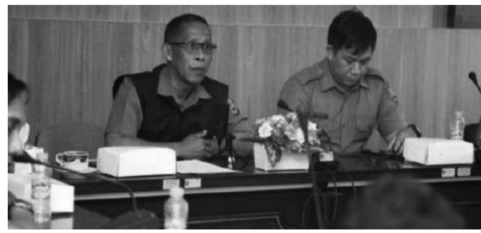
Bupati Bulungan Syarwani saat menghadiri webinar terkait pencegahan stunting di kantor Bappeda, Senin (24/7/23)

Pemkab Bulungan juga mengupayakan kolaborasi dengan lintas stakeholder terkait pemenuhan air bersih sanitasi yang layak layak dan sanitasi layak. Salah satunya berkolaborasi dengan swasta membangun jamban sehat sejak 2017. (syah)