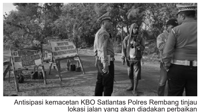
Antisipasi kemacetan KBO Satlantas Polres Rembang tinjau lokasi jalan yang akan diadakan perbaikan

pekerjaan dan arus lalu lintas. "Saat ini diberlakukan sistem buka tutup, untuk memperlancar arus lalu lintas mengingat saat jam pulang karyawan pabrik akan menimbulkan penumpukan kendaraan," tutur KBO. Satlantas Polres Rembang juga mengimbau kepada para pengendara untuk selalu mengikuti aturan lalu lintas, dan dimohon bersabar lantaran ada perbaikan jalan. (Or)