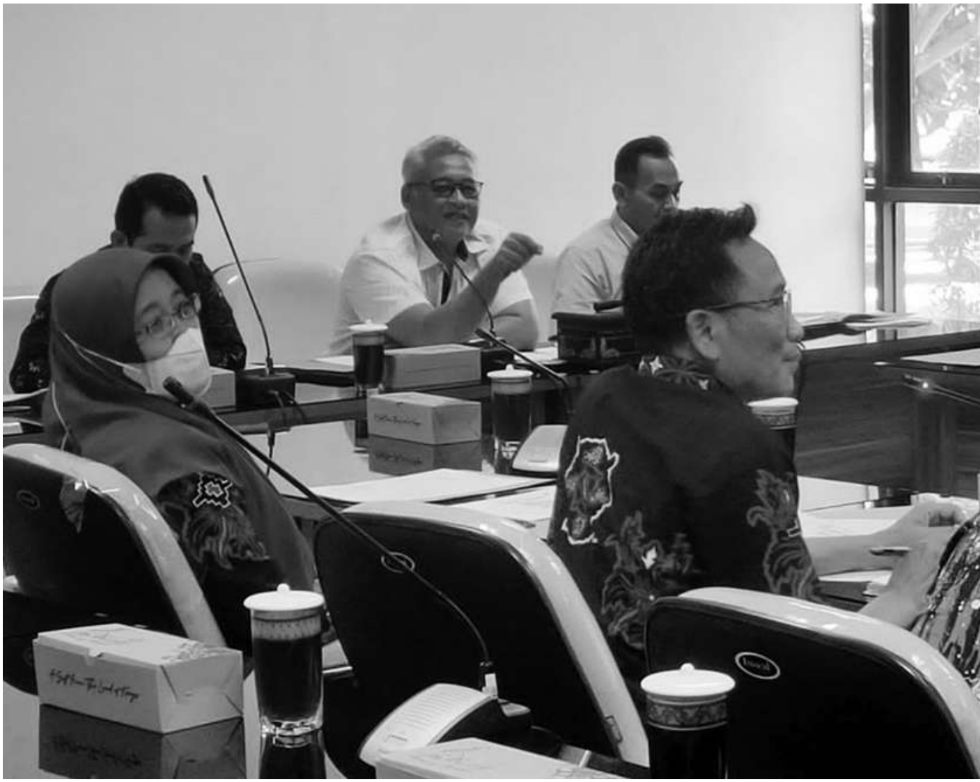
Suasana rapat kerja Komisi IV DPRD Kabupaten Blitar bersama OPD mitra