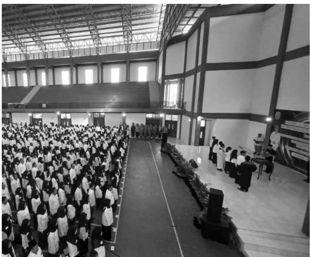
Proses pelantikan dan penyerahan SK PPPK di Kabupaten Trenggalek

"Laporkan saja dan akan saya jaga kerahasiaannya, sudah saya pesankan itu," lanjut Mas Ipin. Sementara itu Kepala Kantor Regional II BKN, Mohammad Ridwan yang juga hadir dalam pelantikan tersebut mengatakan