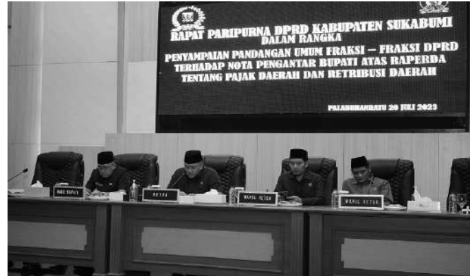
Ketua dan Wakil Ketua DPRD Kabupaten Sukabumi beserta Wakil Bupati Sukabumi Saat Rapat Paripurna di Gedung DPRD Palabuhanratu Sukabumi, Kamis (20/07/2023)

Sukabumi, SMN - Rapat Paripurna Dewan Perwakilan Rakyat Daerah (DPRD) Kabupaten Sukabumi yang ke 15 membahas Pengambilan Keputusan atas dua Raperda tentang Nota Pengantar Bupati Atas Raperda Tentang Pajak Daerah Dan Retribusi Daerah. Rapat tersebut dilaksanakan di