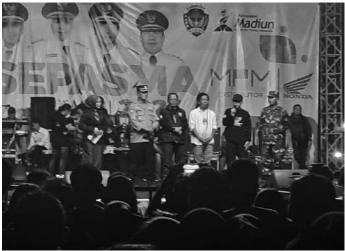
Malam penutupan Sepasma di Alon-Alon Reksogati Caruban Kabupaten Madiun yang dihadiri sejumlah pejabat di lingkup Kabupaten Madiun juga turut hadir dirut Perumda air Minum Tirta Dharma Purabaya dan Air minum kemasan Yoiki

ke 455 tahun 2023 yang dimulai tanggal 15-27 Juli 2023 yang bertempat di Alon-Alon Reksogati Kabupaten Madiun.