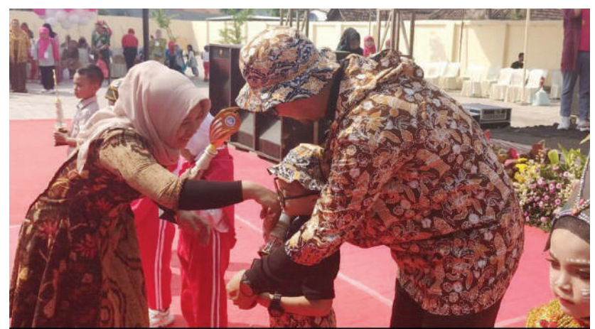
Foto Samping: Walikota Mojokerto Hj Ika Puspita saat memberikan hadiah dan ucapan selamat bagi usia dini yang berprestasi

Menurut Ning Ita, untuk naik kategori diperlukan beberapa indikator yang harus ditingkatkan. "Penyumbang dari kenaikan