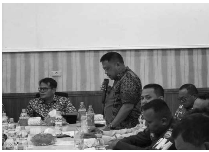
Pemkab Labuhanbatu gelar rapat persiapan peringatan HUT RI ke - 78

Labusel, SMN - Pemkab Labuhanbatu Selatan menggelar rapat persiapan peringat