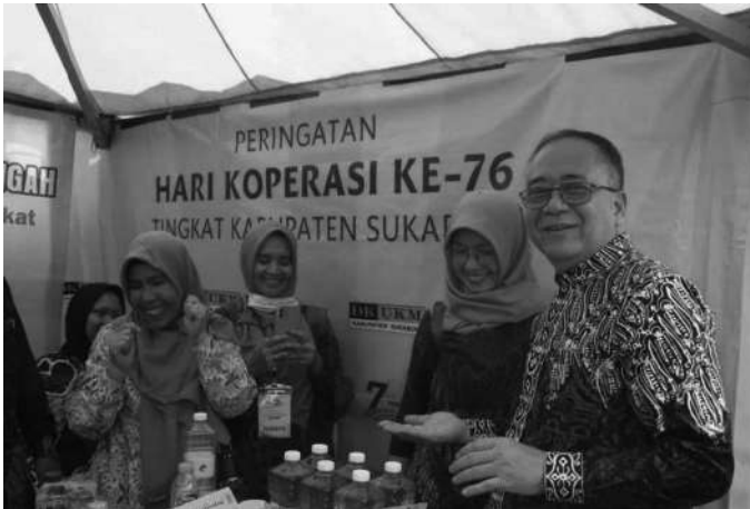
Wakil Bupati Sukabumi Iyos Somantri menghadiri gebyar Hari Koperasi ke 76 tingkat Provinsi Jawa Barat

Sukabumi, SMN - Wakil Bupati Sukabumi Iyos Somantri mengatakan gebyar hari Koperasi diharapkan dapat meningkatkan perkoperasian