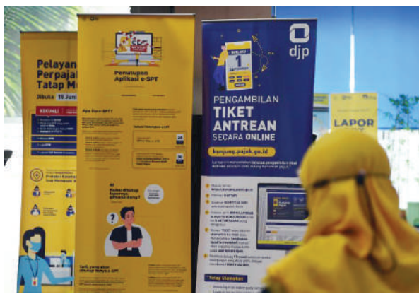
Ilustrasi - Seorang Wajib Pajak sedang mengantri di Kantor Pelayanan Pajak

di Indonesia relatif lebih tenang dihadapi. “Pemerintah secara berkelanjutan melakukan reformasi perpajakan dan penerapan teknologi otomasi perpajakan,” kata Robert dalam diskusi Indonesia Tax Outlook 2023: Navigating Tax Opportunities and Risks, Kamis (2/2/2023). Selain itu, Robert menilai pemerintah juga melakukan kerja sama mul-