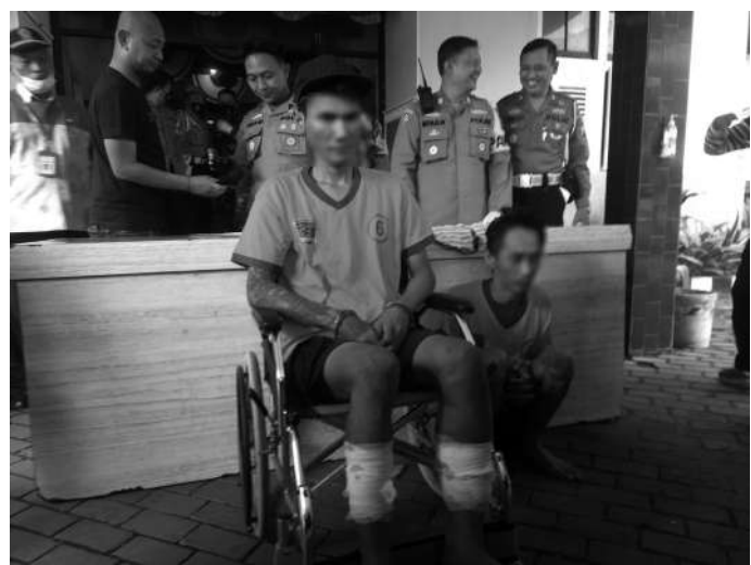
Press release Satreskrim Polsek Tegalsari terkait resedivis curanmor

petugas berhasil menyita baju dan topi yang dipakai pada saat melakukan pencurian, satu buah set kunci T, dan Rekaman CCTV. Saat ini pelaku diancam dengan pasal 363 ayat (1) KUHP dengan ancaman hukuman selama-lamanya 5 tahun penjara. (Dn)