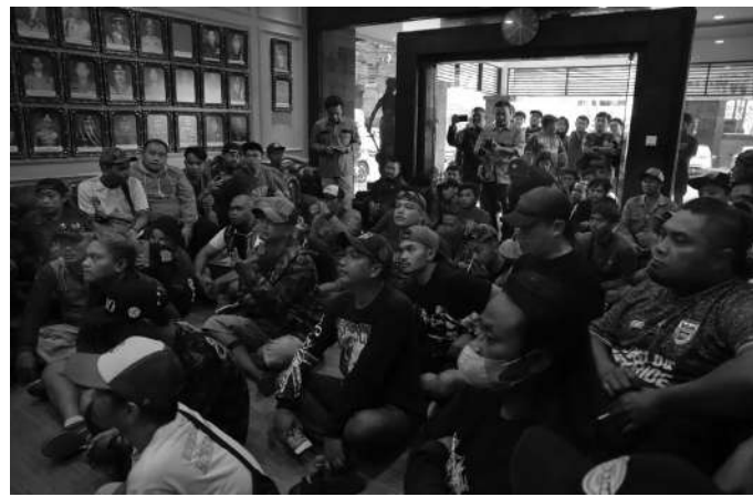
Suporter Aremania yang mendatangi Mapolresta

Malang, SMN - Sejumlah orang yang tergabung dalam suporter singo edan Arema FC mendatangi Mapolresta Malang Kota pada Selasa sore, (31/1/2023).