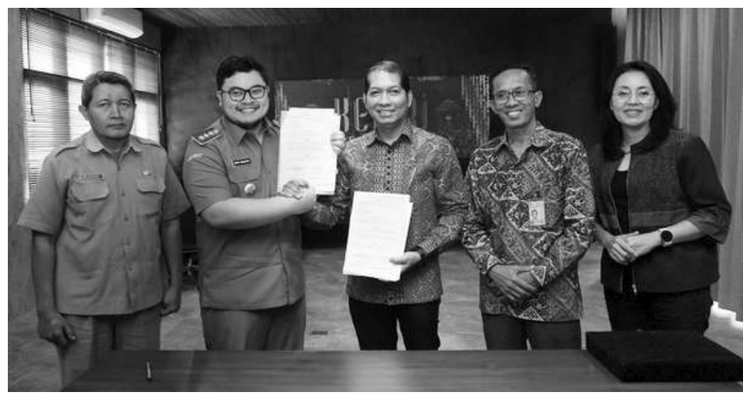
Pemerintah Kabupaten Kediri berkolaborasi dengan PT. Gapura Angkasa merencanakan pembuatan learning center

Kab. Kediri, SMN - Pembangunan bandara baru di Kabupaten Kediri memunculkan multiplier effect, salah satunya penyerapan tenaga kerja lokal. Pemerintah Kabupaten Kediri sedang mempersiapkan skema penyerapan tenaga kerja tersebut. Salah satu yang dilakukan Pemerintah Kabupaten Kediri dalam memperluas peluang penyerapan tenaga kerja adalah dengan mempersiapkan tenaga lokal melalui pelatihan dan pendidikan kebandarudaraan. Bupati Kediri Hanindhito Himawan Pramana berharap usai pendidikan dan pelatihan tersebut banyak tenaga ahli yang siap untuk bekerja di bandara baru yang rencana akan beroperasi di tahun 2023 ini. "Selain mempersiapkan infrastruktur atau jalan-jalan alternatif dan jalan tol, kami (Pemerintah Kabupaten Kediri) juga harus mempersiapkan SDM," kata bupati yang akrab disapa Mas Dhito itu pada Senin (30/1/2023). Dengan kesiapan SDM yang mumpuni, lanjut Mas Dhito, maka akan berbanding lurus