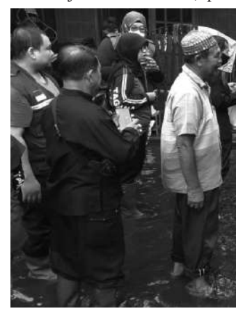
Kondisi Kampung dok yang tergenang air

dengan jumlah orang yang terdampak di masing-masing rumah. Sekitar jam 07.00 WIB, para