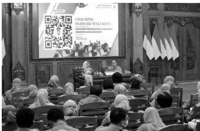
Wali Kota Mojokerto didampingi kepala BKPSDM saat coaching ASN

Kota Mojokerto, SMN - Pemerintah Kota (Pemkot) Mojokerto melalui Badan Kepegawaian dan Pengembangan Sumber Daya Manusia (BKPSDM) mendapat penghargaan terbaik pertama atas capaian Kerjasama penyelenggaraan pe-