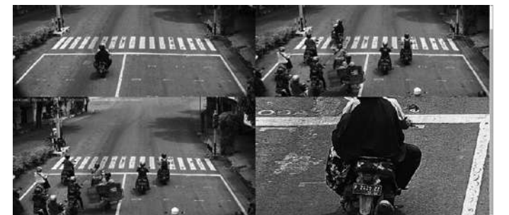
Sejumlah pengemudi memalsukan pelat nomor kendaraan untuk mengelabui ETLE Mobile dan ETLE Statis, Kamis (2/2)

Kasus seperti ini bukan hanya terjadi di Banyuwangi. Hampir seluruh kabupaten lain mengalami persoalan serupa. Daerah lain bahkan lebih parah, ada yang nopolnya sengaja ditutup menggunakan pakaian. "Kakorlantas Polri kembali