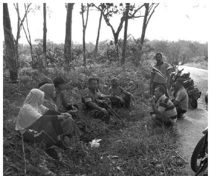
Pj. Kades Desa Mandalasena terlihat saat istirahat bersama para kaur, kades dan Babinsa Desa Mandalasena

Turut serta dalam kegiatan gotong royong seluruh kades se - Desa Mandalasena, para kaur desa, Para LKMD Desa Mandalasena dan masyarakat. (jr)