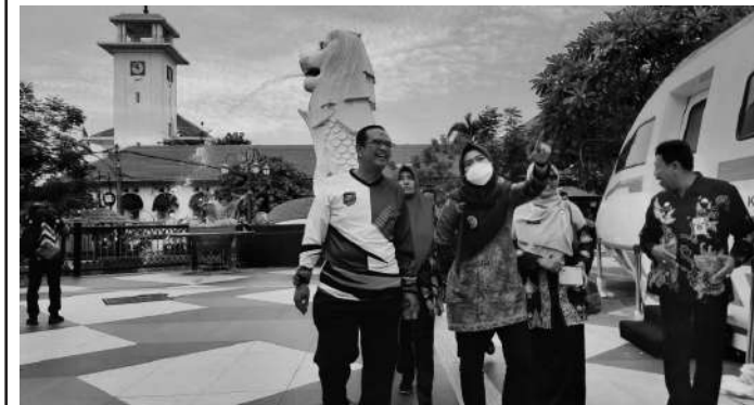
Pemkot Madiun bersama Bupati Demak dan jajarannya mendatangi Kota Madiun dalam acara belajar tata kelola kota dalam mengatasi banjir di wilayah Kabupaten Demak

"Luar biasa sekali, dan tentunya kami tadi benar-benar belajar, baik dari pak Walikota, pak Sekda. Termasuk penanganan sampah dan pemberdayaan UMKM ini yang luar biasa. Selain itu masih banyak sekali yang kita dapat di Kota Madiun ini," tandasnya. (Sy)