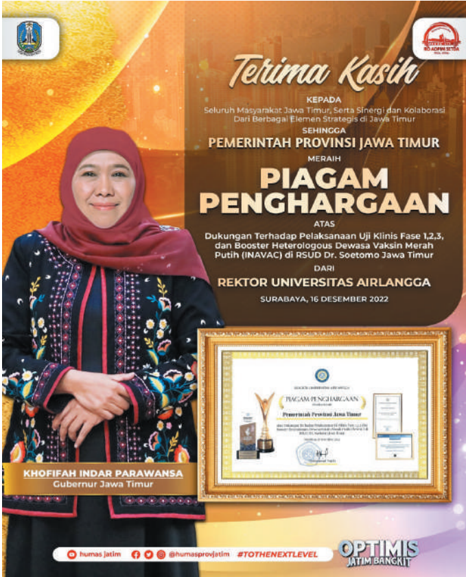
Pemprov Jatim Raih Penghargaan Rektor Unair Atas Dukungan Pelaksanaan Uji Klinis Vaksin Merah Putih (INAVAC)

Surabaya, SMN - Sebagai bentuk apresiasi terhadap keseriusan dalam mendukung produksi vaksin Covid-19 karya anak bangsa, Pemerintah Provinsi Jawa Timur secara khusus mendapat penghargaan dari Universitas Airlangga Surabaya.