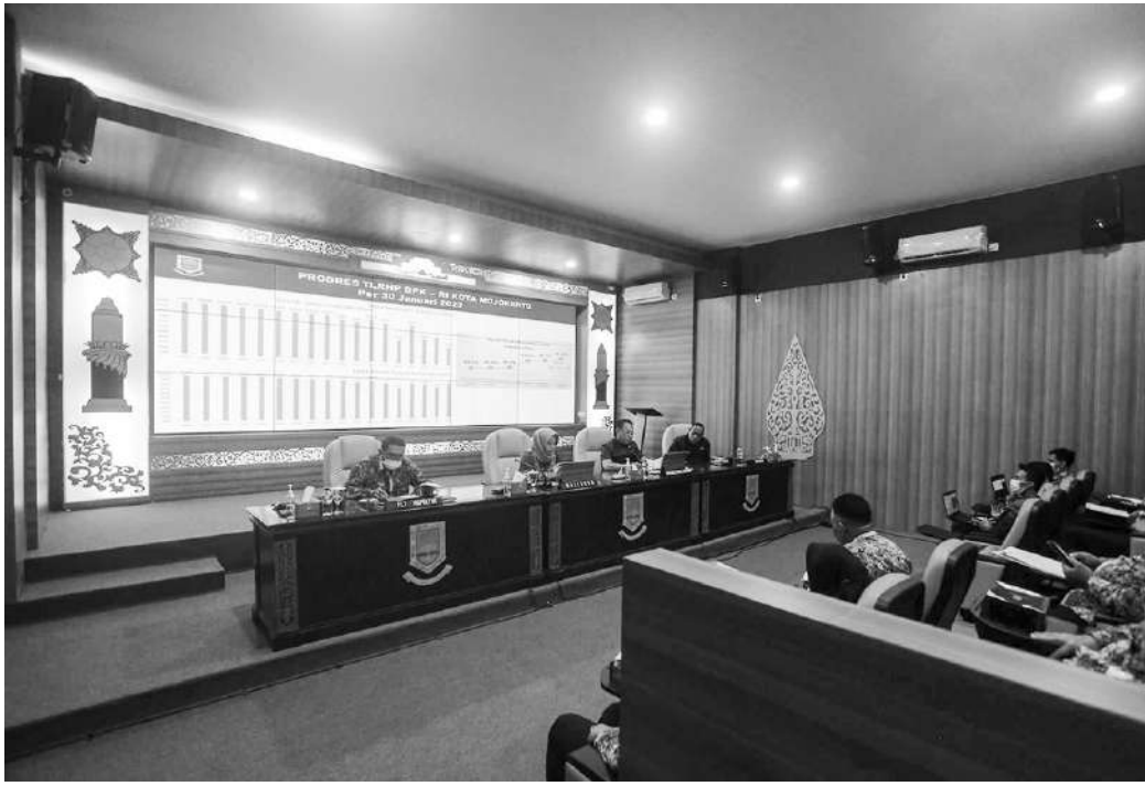
Rapat Evaluasi MCP dan Tindak Lanjut Rekomendasi Hasil Pemeriksaan (TLRHP) BPL RI Tahun 2022 dan Rencana Target Tahun 2023

Kota Mojokerto, SMN - Pemerintah Kota (Pemkot) Mojokerto menunjukkan komitmen serius dalam upaya pencegahan korupsi. Terbukti dengan trend nilai MCP (Monitoring Control for Prevention) yang mengalami kenaikan setiap tahunnya. Berdasarkan paparan Wali