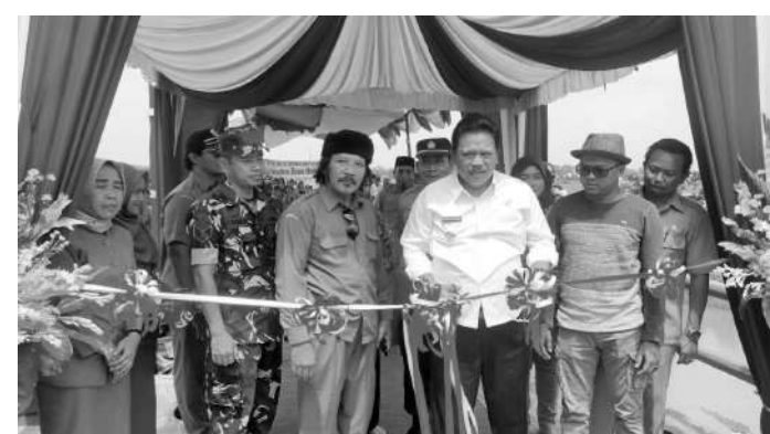
Plt Bupati Nganjuk Marhaen Djumadi saat meresmikan jembatan di Desa Garu, Baron

Nganjuk, SMN - Untuk mendukung dan meningkatkan mobilitas serta laju perekonomian daerah dan aktifitas masyarakat, Pemerintah Kabupaten (Pemkab) Nganjuk terus meningkatkan pembangunan infrastruktur. Salah satunya dengan membangun jembatan di Desa Garu Kecamatan Baron Kabupaten Nganjuk ini. Jembatan ini sebelum dibangun cukup sempit