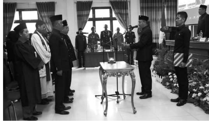
Prosesi mutasi 118 tenaga struktural dan 218 tenaga perbantuan di berbagai OPD Kabupaten Ngawi

Perputaran pejabat pemerintahan di Ngawi, juga meliputi pengangkatan kepala sekolah beberapa SD dan SMP yang selama ini belum terisi. Jabatan sekretaris dinas dan kabin juga mengalami perubahan. (ari)