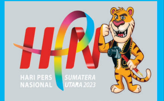
Logo HPN 2023