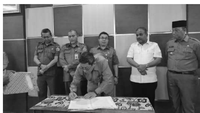
Bupati Karimun menyerahkan Dokumen Pelaksanaan Anggaran-Satuan Kerja Perangkat Daerah (DPA-SKPD) tahun 2023

"Di tahun 2023 pasca pandemi ini, sudah saatnya kita harus lebih kerja keras lagi karena ini momentum bangkit untuk memulihkan ekonomi masyarakat yang terpuruk 2 tahun belakangan. Mari bergandengan tangan untuk mewujudkannya," terang Bupati.