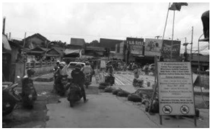
Progres pembangunan Jembatan Jatijajar

Depok, SMN - Kepala Dinas Pekerjaan Umum dan Penataan Ruang (DPUPR) Kota Depok,