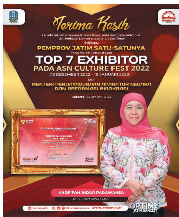
Pemprov menjadi satu-satunya Provinsi yang menerima penghargaan Top 7 Exhibitors dalam ASN Culture Fest 2022

Kempan RB memberikan penghargaan kepada 7 exhib-