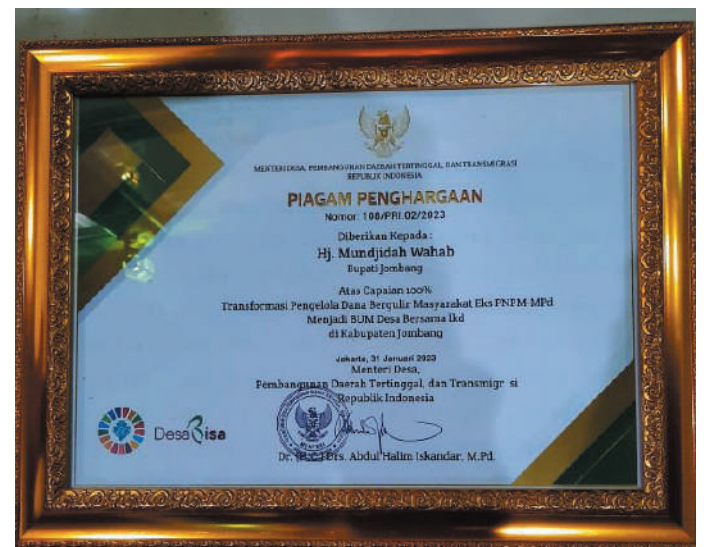
Bupati Jombang Hj. Mundjidad Wahab menerima Penghargaan dari Menteri Desa, Pembangunan Daerah Tertinggal, dan Transmigrasi Republik Indonesia

"Semoga penghargaan ini memotivasi kami, untuk terus berkinerja terbaik dalam rangka meningkatkan ekonomi desa melalui BUMDesa. Mari kita bersama perkuat komitmen untuk masa depan BUM Desa sekaligus secara aktif terlibat dalam pengembangan BUM Desa," pungkas Bupati Mundjidad Wahab. (kmf/kan)