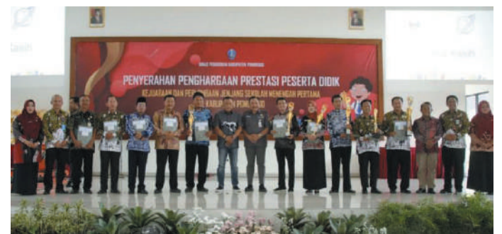
Acara penyerahan penghargaan bagi pelajar Ponorogo berprestasi di Graha Dwija PGRI

penyerahan penghargaan bagi pelajar Ponorogo berprestasi di Graha Dwija PGRI, Kamis (2/2/2023).