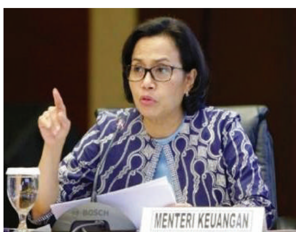
Menteri Keuangan Sri Mulyani Indrawati