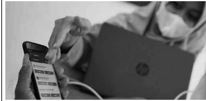
Pemkot Madiun saat ini layanan Identitas Kependudukan Digital (IKD) sudah sampai ke masyarakat umum melalui Dispendukcapil Kota Madiun

Madiun, SMN - Layanan Identitas Kependudukan Digital (IKD) di Kota Madiun sudah sampai kepada masyarakat umum. Petugas Dinas Kependudukan dan Pencatatan Sipil (Dispendukcapil) Kota Madiun sengaja turun gunung ke tiap kelurahan untuk membantu masyarakat meng-install IKD tersebut.