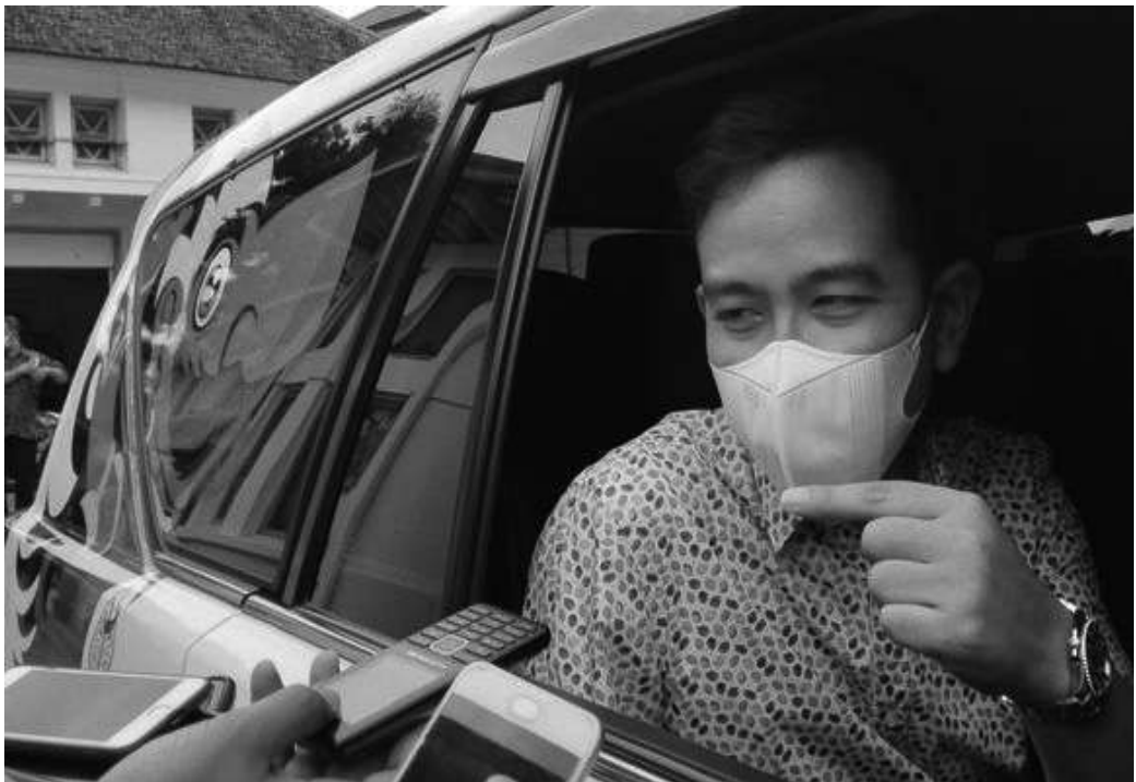
Wali Kota Solo Gibran Rakabuming Raka

Solo, SMN - Wali Kota Solo Gibran Rakabuming Raka angkat bicara terkait dengan kenaikan tarif Pajak Bumi dan