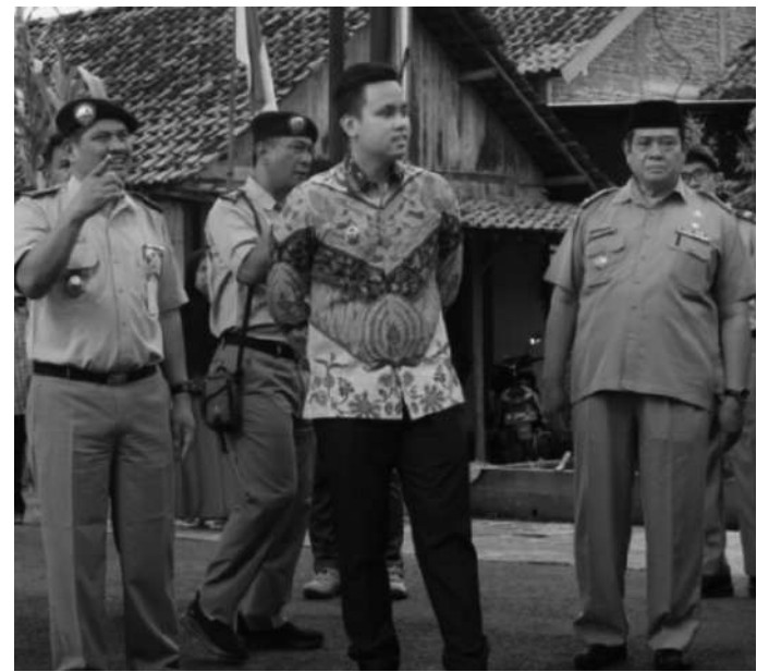
Bupati Kendal hadir Pencanangan Gerakan Masyarakat Pemasangan Tanda Batas (GEMAPATAS) 1 juta patok batas secara serentak di seluruh Indonesia

Kemudian acara dilanjutkan dengan penandatanganan berita acara GEMAPATAS antara Bupati Kendal dan Kepala Kantor Pertanahan Kabupaten Kendal. Serta, penyerahan sertifikat PTSL kepada masyarakat Desa Rejosari. (Suroto Anto Saputro)