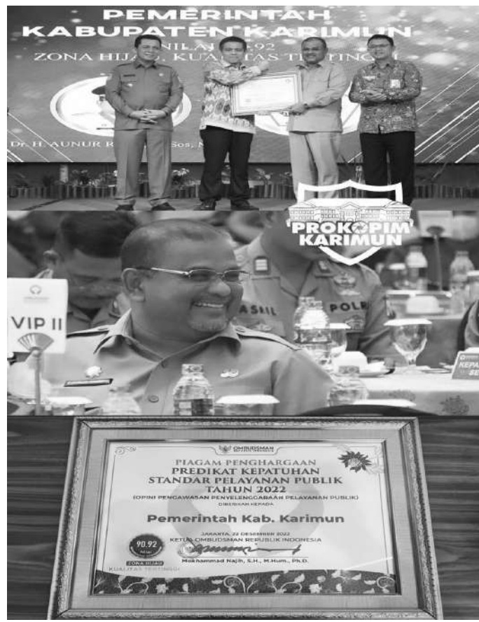
Pemkab Karimun meraih peringkat 1 atau nilai tertinggi pada penghargaan Predikat Kepatuhan Standar Pelayanan Publik tahun 2022

"Pemkab Karimun sangat berkomitmen dan alhamdulillah tahun ini kita peringkat 1, maka di tahun berikutnya kita akan terus berupaya lebih baik lagi dalam memberikan pelayanan terbaik ke masyarakat," terang Bupati. (tbl)