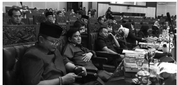
Suasana sidang paripurna dengan agenda mendengarkan tanggapan Walikota Malang atas tanggapan fraksi-fraksi

"Jadi disusunnya Ranperda untuk disahkan menjadi Perda dalam rangka untuk menjamin keamanan sebagai payung hu-