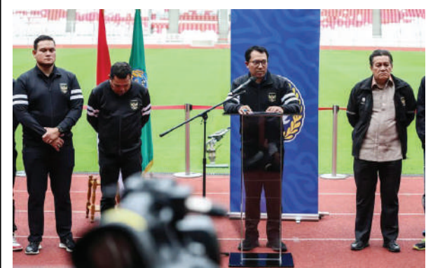
Komite Pemilihan PSSI saat mengumumkan hasil verifikasi calon penghuni komite eksekutif 2023.