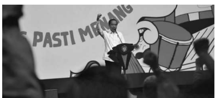
Presiden RI Joko Widodo (Jokowi) saat memberikan sambutan pada acara Peringatan 8 Tahun dan Kopi Darat Nasional Partai Solidaritas Indonesia (PSI)

Jakarta, SMN - Pemerintah kini sedang menyusun strategi besar agar Indonesia tidak terjebak dalam negara berpenghasilan menengah atau middle income trap. Tujuan utamanya adalah membangun ekosistem mobil listrik dan baterai kendaraan listrik (EV) agar negara