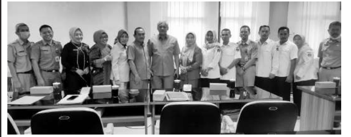
Komisi IV DPRD Kabupaten Blitar bersama Dinas Pendidikan

Blitar, SMN - Komisi IV DPRD Kabupaten Blitar menggelar hearing atau rapat dengan bersama Dinas Pendidikan dan perwakilan guru Pegawai Pemerintah dengan Perjanjian Kerja (P3K), di ruang rapat kerja DPRD Kabupaten Blitar, Senin (30/01/2023).