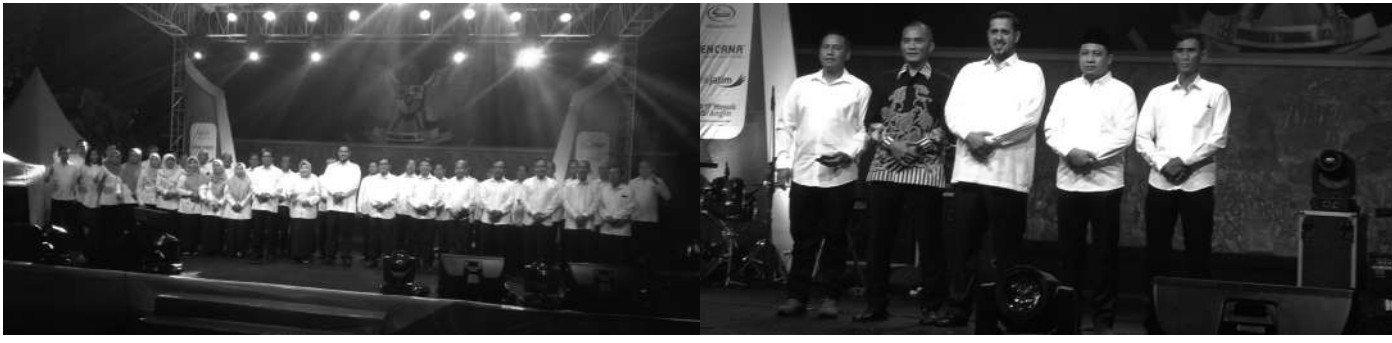
Wali Kota Hadi Zainal Abidin bersama Forkopimda dan kepala OPD di malam refleksi 4 tahun kepemimpinannya

Probolinggo, SMN - Wali Kota Hadi Zainal Abidin menggelar malam refleksi 4 tahun kepemimpinannya di Alun-alun Kota Probolinggo, kepada seluruh jajaran Forkopimda, Kepala OPD dan juga kepada seluruh masyarakat Kota Probolinggo. (29/1).