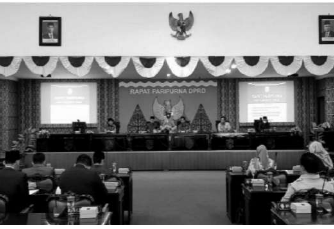
Rapat Paripurna DPRD mengenai persetujuan bersama Raperda Rencana Pembangunan Industri Kabupaten Kendal Tahun 2022-2024

Kendal, SMN - Pemerintah Kabupaten Kendal bersama dengan DPRD Kendal melakukan persetujuan bersama Raperda Rencana Pembangunan Industri Kabupaten Kendal Tahun 2022-2024, Jumat (27/1/2023) di Aula Gedung DPRD.