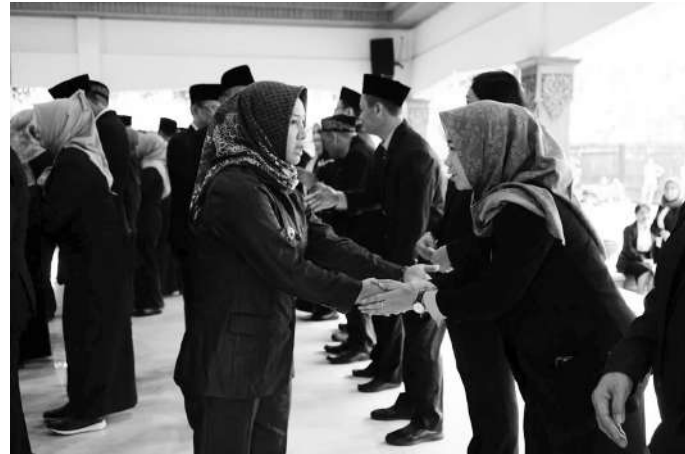
Wali Kota Mojokerto memberikan ucapan selamat kepada para pejabat yang baru dilantik

Lebih lanjut ia menjelaskan bahwa mutasi kali ini adalah kesempatan untuk melakukan penataan SDM di Pemerintah Kota Mojokerto sebelum masa jabatannya berakhir. "Saya akan berusaha sebelum berakhirnya masa kepemimpinannya, untuk menata SDM di dalam pemerintahannya ini semaksimal mungkin agar ke depan jalannya pemerintahan ini bisa berjalan dengan baik dan