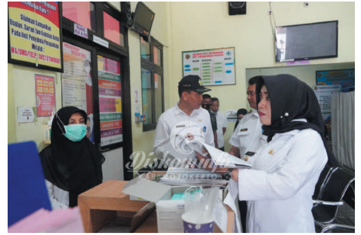
Bupati Mojokerto Ikfina Fahmawati saat meninjau langsung pembangunan gedung baru dan renovasi bangunan empat Puskesmas di Kabupaten Mojokerto

Selain meninjau renovasi bangunan di empat Puskesmas, Bupati Ikfina juga memastikan