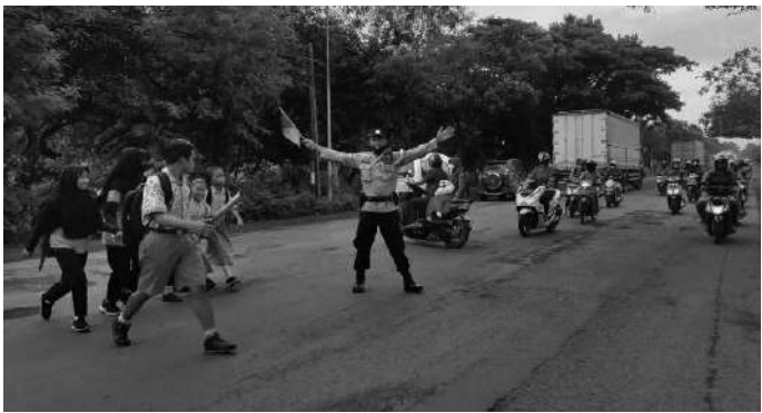
Mapolsek mengawal kepulangan anak sekolah dasar

Selain itu, Karim juga mengingatkan agar masyarakat tidak mudah percaya akan berita-berita hoaks. "Apalagi menyebarkan berita hoaks yang dapat membuat resah masyarakat," tandasnya. (Or SMN)