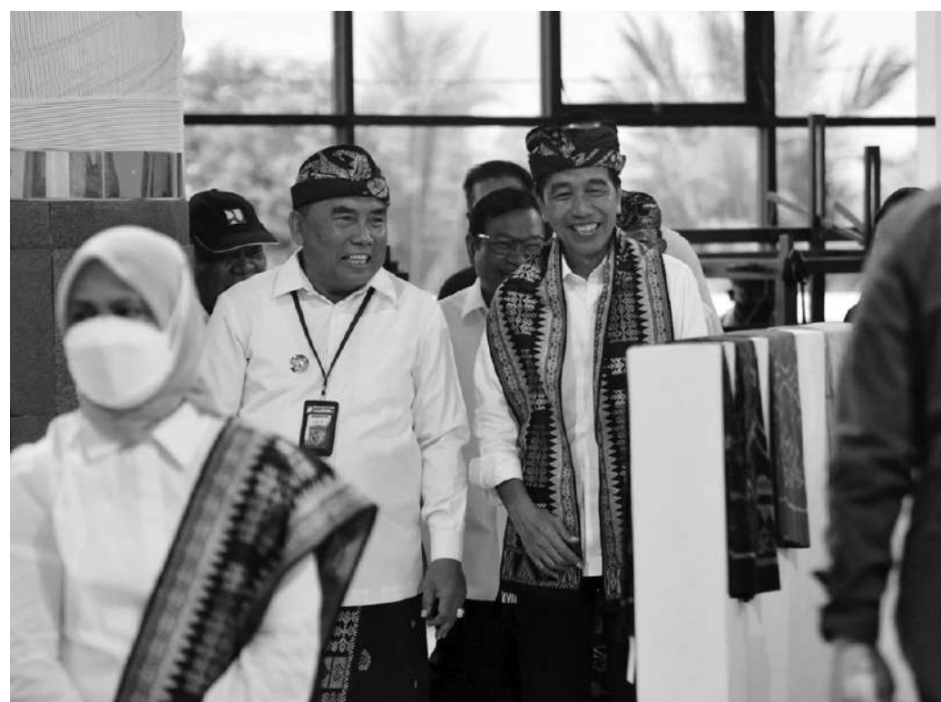
Presiden Jokowi meninjau Sentra Tenun Jembrana, di Kabupaten Jembrana, Kamis (02/02/2023)

“Saya ingin menyampaikan terima kasih, penghargaan atas sambutan masyarakat dan juga