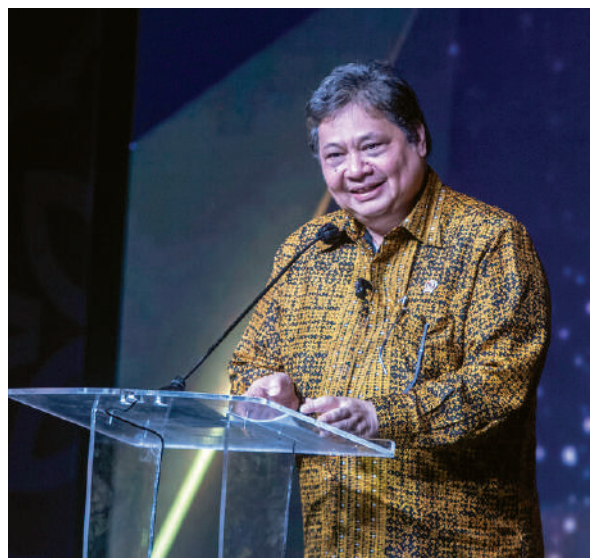
Menteri Koordinator Bidang Perekonomian Airlangga Hartarto

Jakarta, SMN - Pemerintah menargetkan Indonesia bisa menjadi global key player industri hilirisasi berbasis komoditas. Hal