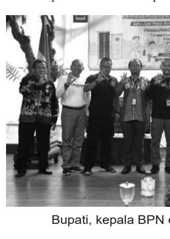
Bupati, kepala BPN dan Kapolres dalam acara Gemapatas

Hal itu disampaikan AKBP Boy Jeckson saat menghadiri kegiatan pemasangan batas tanah serta video conference Menteri ATR/BPN Hadi Tjahjanto di Desa Karang Sari Kecamatan Sukodono, Jumat (3/2/2023) lalu.