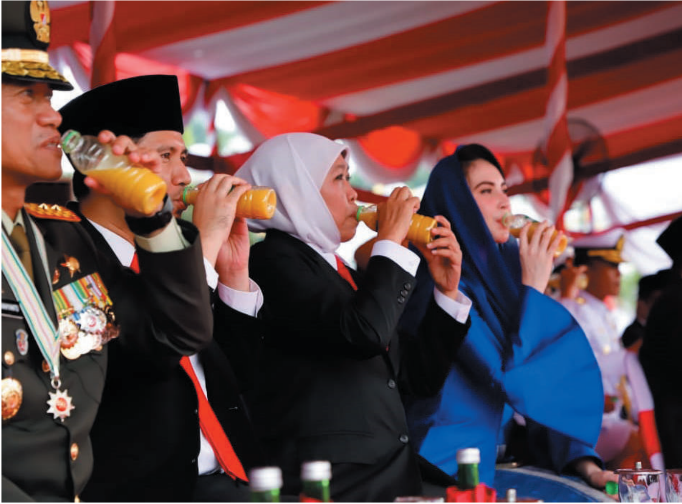
Gubernur Jawa Timur Khofifah Indar Parawansa saat ikut andil dalam rangka aksi minum jamu tradisional beras kencur usai upacara Harwan sebagai simbol kebangkitan UMKM Jatim ini dicatat MURI sebagai yang terbanyak di dunia

Surabaya, SMN - Pemprov Jawa Timur memecahkan dua Rekor Museum Rekor Indonesia (MURI) di Peringatan Hari Pahlawan, Kamis (10/11/2022). Penghargaan MURI tersebut berhasil diraih atas dua kegiatan yang dilakukan di Jawa Timur.