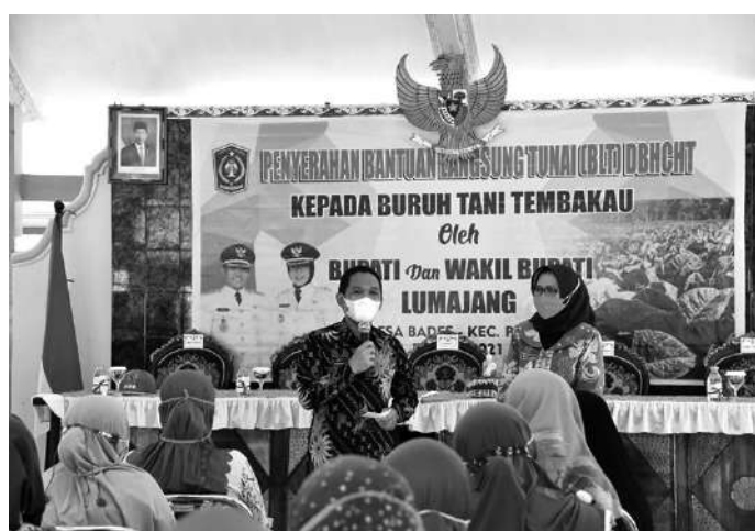
Bupati Lumajang, Thoriqul Haq didampingi Wabup Lumajang, Indah Amperawati saat acara penyerahan Bantuan Langsung Tunai (BLT) Dana Bagi Hasil Cukai Hasil Tembakau (DBHCHT)

"Dari hasil verifikasi, ada 1.697 calon penerima dari buruh tani tembakau, untuk buruh pabrik ada 56 orang calon penerima bantuan yang ada di Kabupaten Lumajang dengan nominal bantuannya 2.100.000 Rupiah," ujarnya.