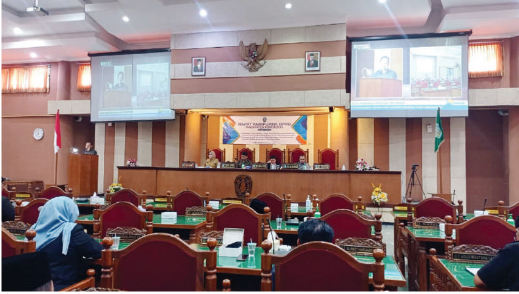
Suasana Rapat Paripurna DPRD Kabupaten Ponorogo di ruang rapat paripurna lantai tiga gedung DPRD Ponorogo, Senin (31/10/2022).

Ponorogo, SMN - Dewan Perwakilan Rakyat Daerah (DPRD) Kabupaten Ponorogo menggelar Rapat Paripurna dengan agenda Pandangan Umum fraksi – fraksi terhadap Rancangan Peraturan Daerah (Raperda) tentang APBD Kabupaten Ponorogo tahun anggaran 2023 dan Pendapat Bupati terkait 3 Rancangan Peraturan Daerah inisiatif DPRD Kabupaten Ponorogo tahun 2022 di ruang rapat paripurna lantai tiga gedung DPRD Ponorogo,