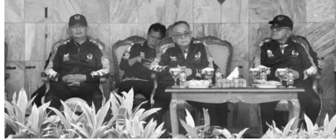
Wakil Bupati Sukabumi H. Iyos Somantri melepas atlet yang akan berlaga dalam Pekan Olahraga Provinsi (Porprov) Jawa Barat ke XIV

"Semoga prestasi terus diraih untuk mewujudkan target 10 besar," pungkasnya. (robby)