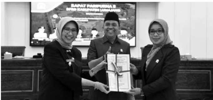
Wakil Bupati Lumajang, Indah Amperawati saat menghadiri Rapat Paripurna II DPRD Kabupaten Lumajang

Lumajang, SMN - Rapat Paripurna II DPRD Kabupaten Lumajang, dihadiri Wakil Bupati Lumajang, Indah Amperawati. Rapat Paripurna II DPRD Kabupaten Lumajang tersebut dilaksanakan dalam rangka penyampaian pendapat badan pembentuk Perda terhadap Rancangan Anggaran Pendapatan dan Belanja Daerah (RAPBD) Tahun Anggaran (TA) 2023, Penyampaian Pendapat Badan Angga-