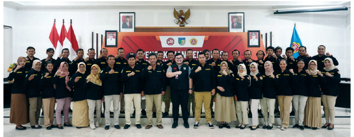
Bupati Kediri Hanindhito Himawan Pramana saat berfoto bersama usai pengukuhan pengurus karang taruna

Capaian MCP diharapkan bukan semata-mata hanya pada capaian data. Melainkan juga harus diterapkan dalam pelayanan dan pengabdian kepada masyarakat, baik melalui pemerintah daerah maupun DPRD Kabupaten Kediri. (Kmf/adv/kan)