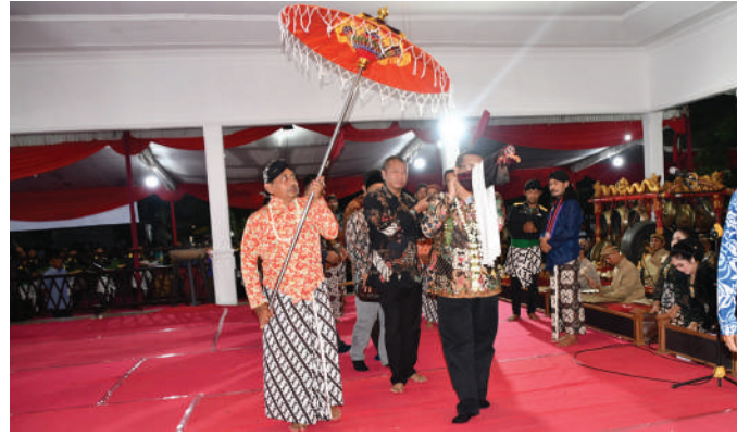
Bupati Maryoto saat memboyong pusaka tombak kajeng kyai upas

Ini merupakan kado hari jadi Kabupaten Tulungagung ke 817 tahun 2022 ini bahwa kita sudah memiliki kembali aset sejarah yang berbeda di tengah kota ini. (ADV/hms/kan)