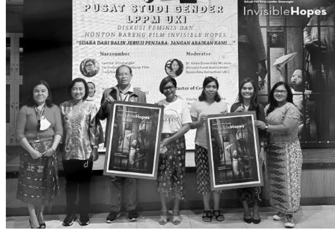
Karya Lamtiar Simorangkir "Invisible Hopes" yang pemenang Piala Citra untuk Film Dokumenter Panjang Terbaik di Festival Film Indonesia (FFI) tahun 2021 dan Piala Maya 2022

Jakarta, SMN - Karya Lamtiar Simorangkir "Invisible Hopes" yang sekaligus pemenang Piala Citra untuk Film Dokumenter Panjang Terbaik di Festival Film Indonesia (FFI) tahun 2021 dan Piala Maya 2022. Kembali mendapat sambutan hangat bagi dunia Pendidikan. Salah satunya Pusat Studi Gender Universitas Kristen Indonesia melakukan Diskusi Feminis dan Nobar Film "Invisible Hopes" di Ruang Seminar Kampus UKI Cawang pada Rabu (9/11) diikuti oleh dosen dan Mahasiswa dari berbagai Fakultas.