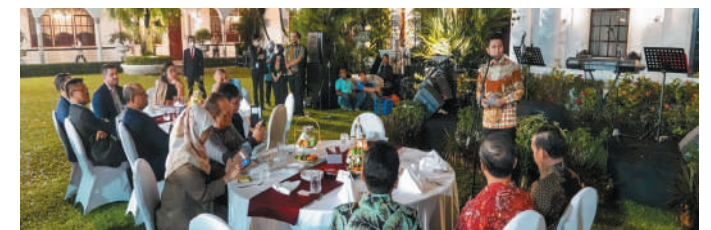
Wagub Jatim Emil Elestianto Dardak saat menghadiri Gala Dinner World University Association for Community Development (WUACD) Summit in Conjunction with International Conference on Community Development 2022

Surabaya, SMN - Masyarakat sebagai pemegang kekuasaan absolut memiliki kekuatan yang besar untuk mengubah situasi sosial maupun bernegara. Termasuk dalam mengembangkan kapasitas sesuai yang diharapkan kebanyakan orang.