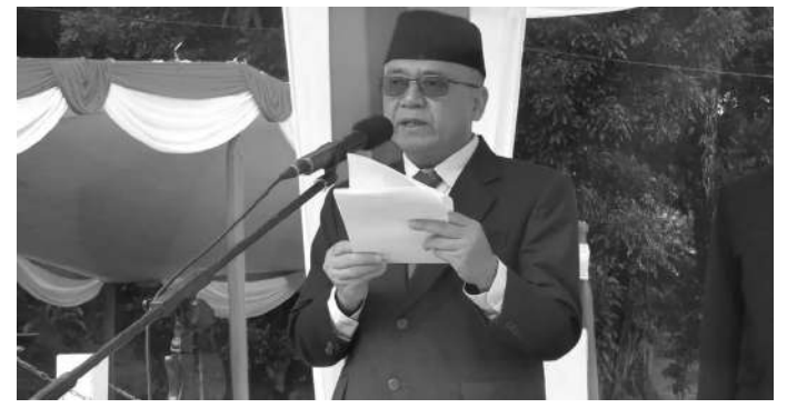
Wakil Bupati Sukabumi H. Iyos Somantri

percaya bahwa masa depan Anak dan Cucu generasi penerus bangsa Indonesia sangat layak untuk diperjuangkan.