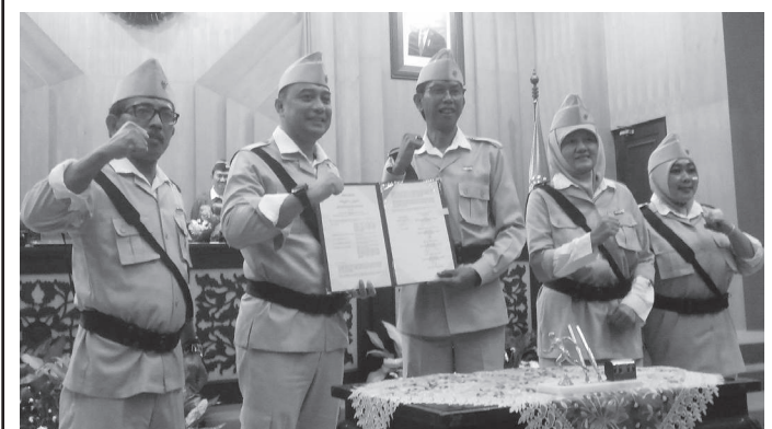
APBD Kota Surabaya tahun 2023 disahkan 11,2 triliun tepat di Hari Pahlawan

"Teman-teman DPRD semuanya sangat rajin dan teliti untuk melakukan pengawasan pelaksanaan pembangunan di Surabaya. Semoga di tahun 2023 Surabaya terus membaik dan lebih maju," pungkasnya. (Dn/Tim)