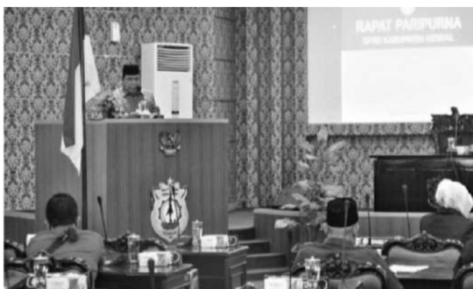
Rapat Paripurna DPRD Kendal

Kendal, SMN - Kami menyampaikan terima kasih dan apresiasi kepada Fraksi-fraksi DPRD Kendal yang telah memberikan tanggapan dan pandangannya secara umum terhadap 2 (dua) Raperda Kabupaten Kendal yang telah disampaikan dalam Pandangan Umum Fraksi-fraksi DPRD terhadap 2 (dua) Raperda Kabupaten Kendal pada hari Rabu tanggal 2 November 2022 kemarin.