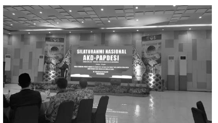
Pertemuan kades dengan pengurus pusat PDI Perjuangan Hasto Kristiyanto, di Ngawi.

Menurut Munawar, beberapa pertimbangan jadi dasar untuk mengusulkan perubahan perio-