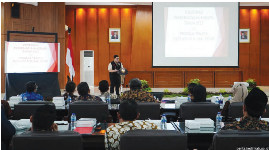
Bupati Kediri Hanindhito Himawan Pramana saat kegiatan koordinasi pemberantasan korupsi tahun 2022 dan program tematik oleh KPK RI di Kabupaten Kediri

Kab. Kediri, SMN - Bupati Kediri Hanindhito Himawan Pramana mendorong capaian MCP (Monitoring Center for Prevention) Kabupaten Kediri tahun 2022 mencapai 90 persen. MCP merupakan aplikasi yang dikembangkan KPK untuk melakukan monitoring capaian kinerja program pencegahan korupsi, melalui perbaikan tata kelola pemerintahan yang dilaksanakan pemerintah daerah.