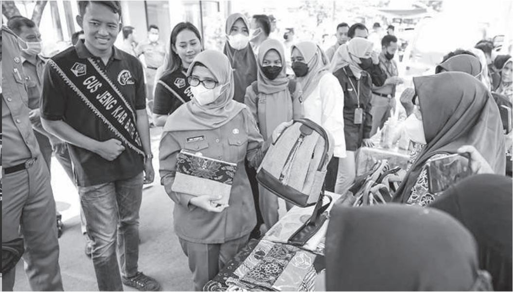
Bupati Blitar Rini Syarifah saat kegiatan sambang desa di Desa Bangle dan Kelurahan Kanigoro