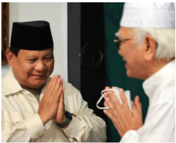
Menteri Pertahanan RI, Prabowo Subianto menemui salah satu tokoh nasional yaitu: KH Ahmad Mustofa Bisri (Gus Mus) Pengasuh Pondok Pesantren Raudlatul Thalibin di Kelurahan Leteh Rembang, Jawa Tengah