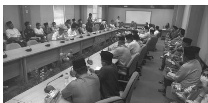
Suasana Rapat Koordinasi DPRD Kota Batam Bersama Camat dan Lurah se-Kota Batam

"Bahwa hari ini kita meyampaikan bahwa Perwako No 22 Tahun 2020 Tentang Pedoman Pembentukan Lembaga Kemasyarakatan Kelurahan Di Kota Batam. Pemilihan RT/RW perlu di sampaikan penyempurnaan, dan itu sudah disampaikan oleh bagian Hukum agar segera dilaku-