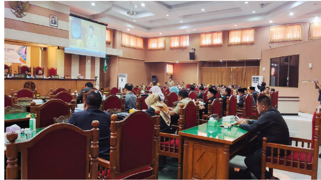
Suasana Rapat Paripurna DPRD Kabupaten Ponorogo di ruang rapat paripurna lantai tiga gedung DPRD Ponorogo, Senin (31/10/2022).

Terkait pendapatan asli daerah (PAD), DPRD mendorong pemerintah daerah untuk mengkaji kembali kebijakan tentang kenaikan tarif masuk wisata telaga nebel. Yang menimbulkan dampak berkurangnya jumlah pengunjung, mengakibatkan juga penurunan jumlah Pendapatan Asli Daerah (DPRD/ADV/Kan)