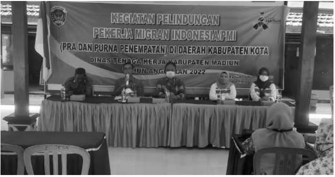
Disnaker Kabupaten Madiun bekerjasama dengan BP2MI Madiun dalam acara kegiatan Pelindungan Pekerja Migran Indonesia / PMI di Pendopo Balai Desa Klorogan Kecamatan Geger Kabupaten Madiun.

Madiun, SMN - Dinas tenaga kerja (Disnaker) Kabupaten Madiun bekerja sama dengan Badan Pelindungan Pekerja Migran Indonesia (BP2MI) Madiun selenggarakan kegiatan pelindungan Pekerja Migran Indonesia baik pra maupun purna penempatan di daerah Kabupaten/ Kota Madiun yang bertempat di pendopo Desa Klorogan kecamatan Geger Kabupaten Madiun, Kamis (10/11/2022).