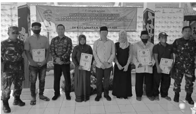
PLH Sekda kota Probolinggo saat penyerahan Bansos

Probolinggo, SMN - Pemerintah Kota Probolinggo kembali menyalurkan bantuan sosial berupa uang dalam rangka penanganan Dampak Inflasi melalui Belanja Tidak Terduga Bersumber dari Dana Insentif Daerah kepada masyarakat kurang mampu di 4 Kecamatan, hari Kamis (10/11) lalu.