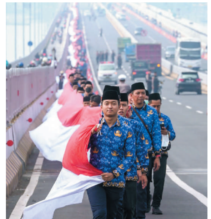
Total ada sebanyak 1.750 orang yang terlibat sebagai peserta yang membentangkan bendera merah putih

"Minum beras kencur massal ini semoga menjadi nafas kebangkitan UMKM Jatim di Hari Pahlawan yang diiringi dengan harapan bahwa UMKM Jatim akan semakin berkembang dan menjadi lokomotif bangkitnya ekonomi Jatim berbasis kuliner lokal," pungkash Khofifah.