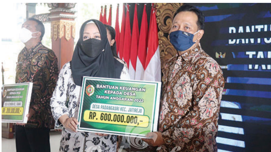
Bupati Ikfina saat menyerahkan Bantuan Keuangan Desa Kabupaten Mojokerto periode 2022 secara simbolis

Kab. Mojokerto, SMN - Pemerintah Kabupaten (Pemkab) Mojokerto sosialisasikan Bantuan Keuangan Desa Kabupaten Mojokerto periode 2022, di Pendopo Graha Maja Tama, Jumat (25/2) pagi.