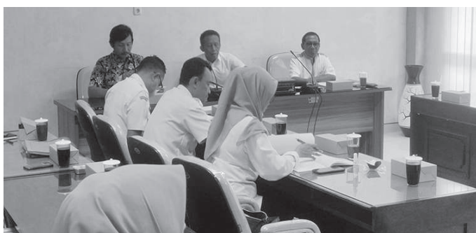
Suasana raker komisi I DPRD Kabupaten Blitar

Blitar, SMN - Dewan Perwakilan Rakyat Daerah (DPRD) Kabupaten Blitar melalui Komisi I menerima permohonan hearing dari Organisasi Kemasyarakatan (Ormas) Gerakan Anak Nasionalis (Gannas), kegiatan itu digelar ruang rapat Komisi I DPRD, Rabu (09/11/2022).