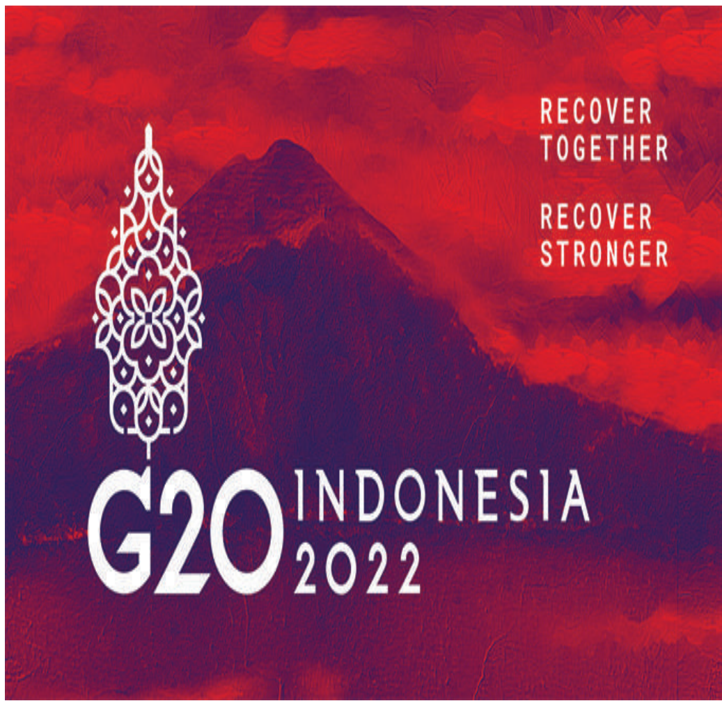
Pandemic fund akan dipergunakan bersama untuk membenahi sistem hingga menanggulangi kesenjangan anggaran lima tahun ke depan