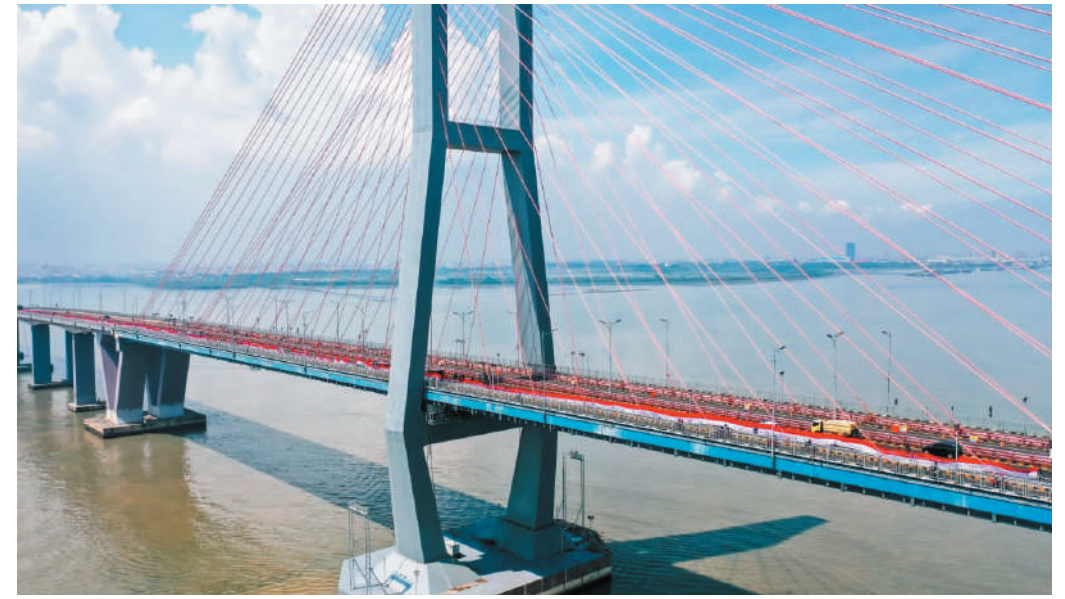
Pembentangan kain merah putih sepanjang 3.219 meter di Jembatan Suramadu