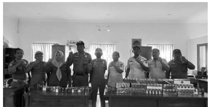
Hasil dari deteksi dini ke 14 kecamatan ditemukan ada sekitar 33 merek rokok ilegal atau tanpa cukai tersebar se Sampang

Sampang, SMN - Pemerintah Kabupaten (Pemkab) Sampang melalui Satuan Polisi Pamong Praja (Satpol PP) membentuk tim satuan tugas (Satgas) pemberantasan rokok ilegal. Tim tersebut berperan untuk melakukan deteksi dini di 14 Kecamatan yang disinyalir menjadi tempat pengiriman rokok tanpa cukai.