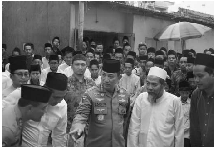
Kapolri Listyo Sigit Prabowo saat bersilaturahmi ke Pondok Pesantren yang ada di Kabupaten Rembang

jalan darat rombongan Kapolri bersilaturahmi ke Pondok Pesantren Al-Anwar Pusat Sarang, Pondok Pesantren Tahfidzul Quran Lembaga Pembinaan Pendidikan Pengembang Ilmu Al Qur'an (LP3IA) Narukan Kra-gan dan yang terakhir di Pondok Pesantren Kauman, Karangturi