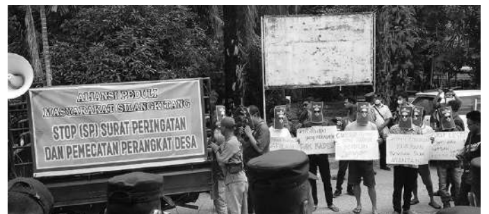
Masyarakat yang tergabung dalam APMS berunjuk rasa di depan kantor kepala desa.

surat pemberhentian perangkat Desa Mandalasena itu sudah kita mediasikan kemaren bersama PJ.kades Mandalasena.