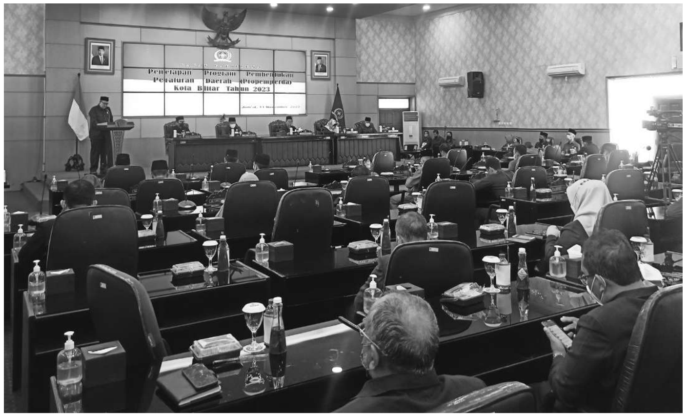
Suasana rapat paripurna DPRD Kota Blitar

Lebih lanjut dijelaskan, dari masing-masing Ranperda yang diajukan bisa tepat waktu, karena setelah dibahas masih perlu dikonsultasikan ke Provinsi Jawa Timur untuk mendapatkan evaluasi, kalau sudah jelas bisa dipakai dasar hukum untuk kegiatan," pungkasnya. (mam/adv)