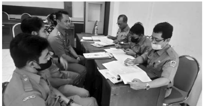
Petugas dinas Pemberdayaan Masyarakat dan Desa (PMD) Kabupaten Madiun mengevaluasi Desk APBDes tahun 2023 masing-masing tiap Desa sekabupaten Madiun secara bergantian.

Madiun, SMN - Dinas pemberdayaan masyarakat dan Desa (PMD) Kabupaten Madiun menggelar kegiatan Desa perencanaan pembangunan desa dalam rangka evaluasi dan sinkronisasi Perdes RKP Desa dengan Raper Desk APBDes tahun 2023 yang dimulai sejak tanggal 8 September sampai dengan 3 November 2022 secara