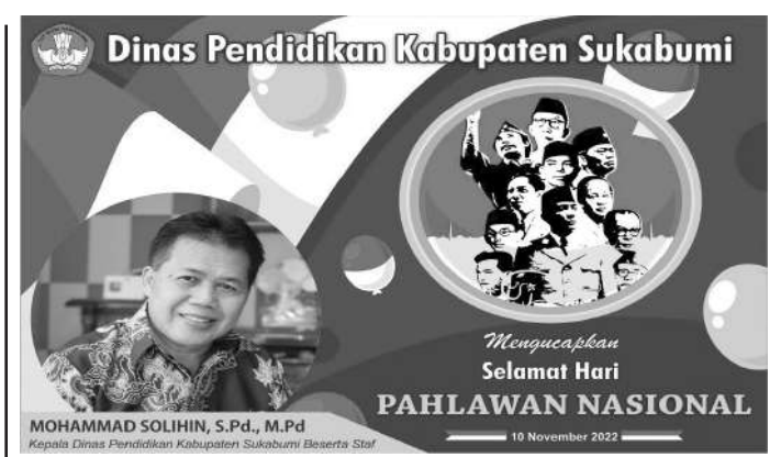
Dinas Pendidikan Kabupaten Sukabumi

Selanjutnya belanja infrastruktur pelayanan publik paling rendah minimal 40 persen, sebesar Rp1,062 triliun atau sebesar 30,52 persen; dan anggaran belanja pendidikan dan pelatihan