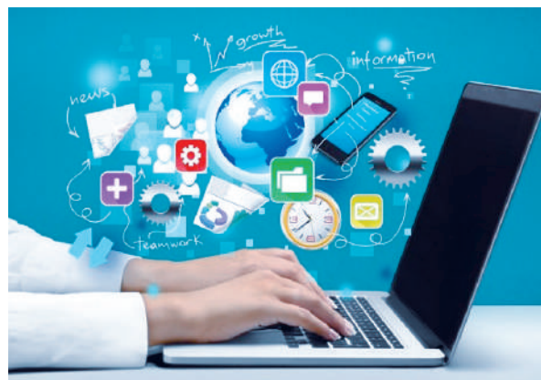
Perkembangan Teknologi dari masa ke masa. Ilustrasi