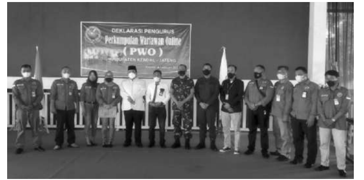
Acara Deklarasi PWO (Perkumpulan Wartawan Online) Kendal yang dilaksanakan di Aldila Resto pada Hari Jum'at 4/2/2022

Sehingga masyarakat menerima informasi yang benar