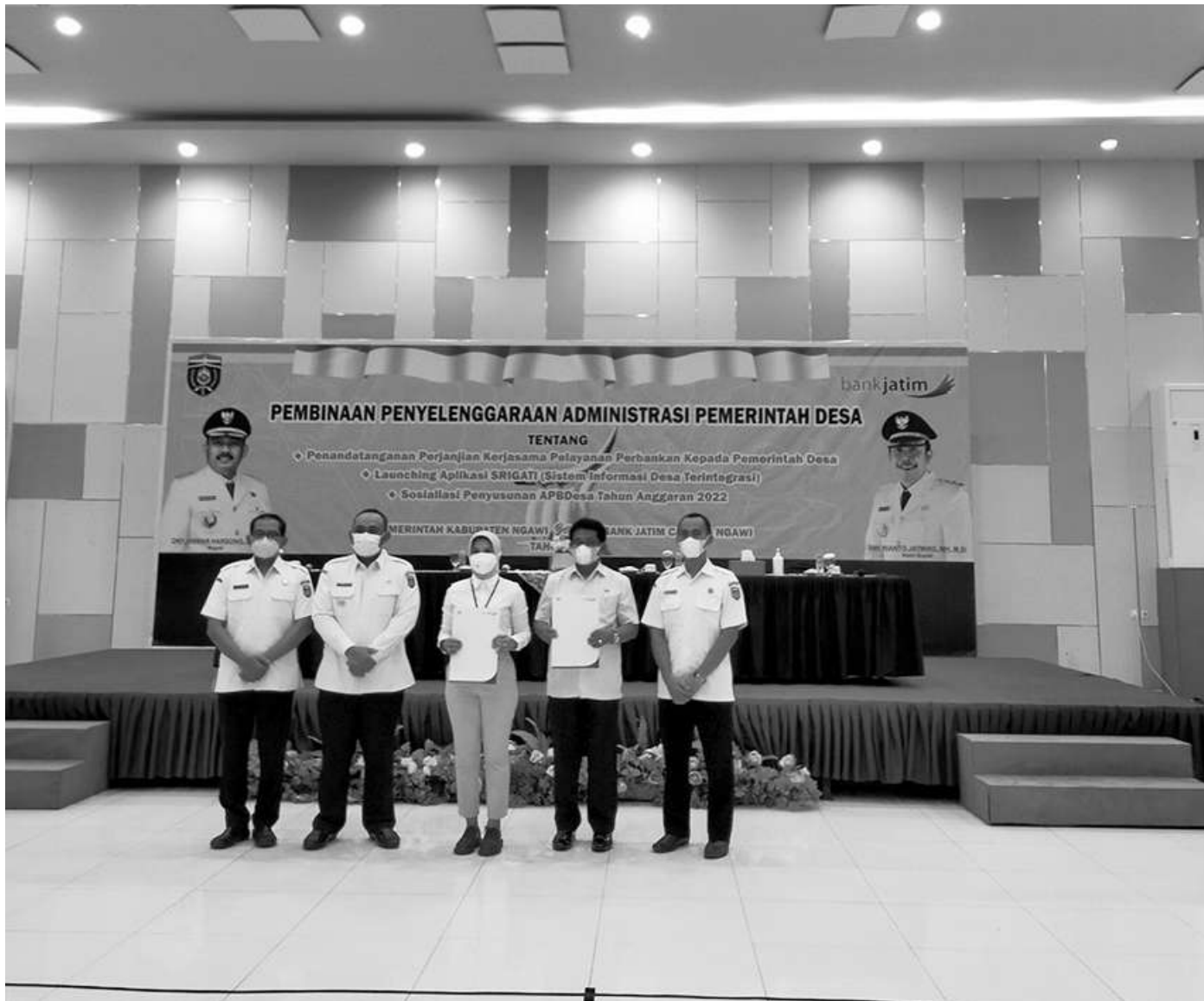
Peluncuran aplikasi Srigati, Rabu (2/2/2022)

Ngawi, SMN - Pemerintah Kabupaten Ngawi meluncurkan aplikasi Srigati, Rabu (2/2/2022). Ini adalah aplikasi berbasis android, singkatan dari Sistem Informasi Desa Terintegrasi. Aplikasi Srigati sendiri, berada dalam pengelolaan Dinas Komunikasi, Informatika, Statistik dan Persandian, Kabupaten Ngawi. Sebagai tahap awal, aplikasi itu akan digunakan untuk