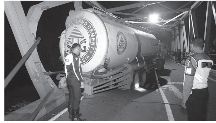
Truk semen yang tabrak Jembatan Ngantru

BBPJN Jatim-Bali Satker Babad-Bojonegoro, setelah melihat kondisi jembatan usai terabrak, merencanakan jembatan pengganti sementara bertonase sekitar 8 ton, dalam waktu secepatnya. (ari)