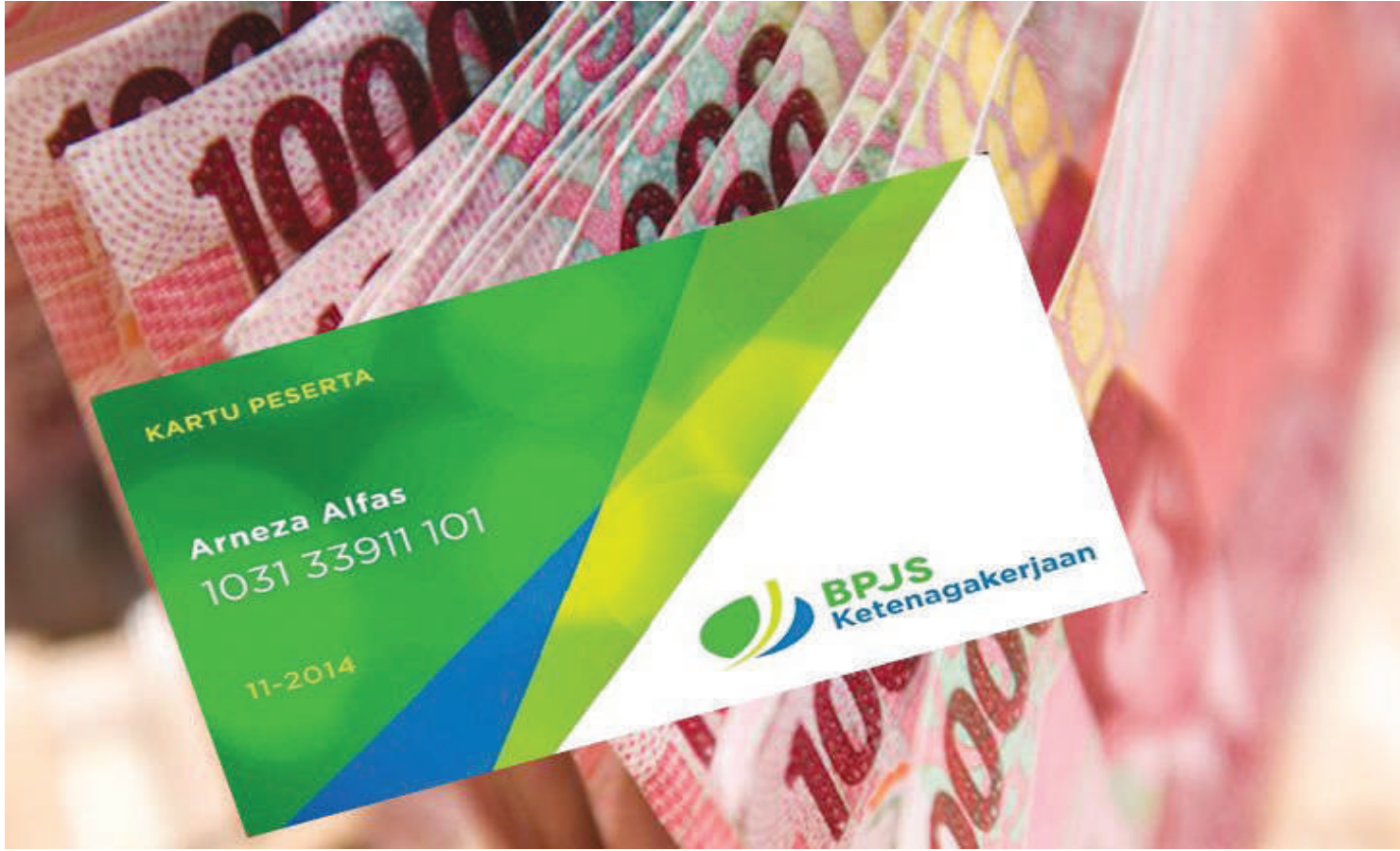
Ilustrasi - BPJS Ketenagakerjaan

Aturan baru tersebut tertuang dalam Peraturan Menteri Ketenagakerjaan Nomor 2 Tahun 2022 tentang Tata Cara dan Persyaratan Pembayaran Manfaat Jaminan Hari Tua (JHT) Jamsostek.