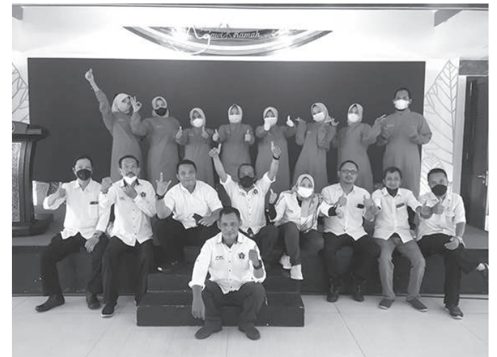
Kebersamaan pengurus PWI Ngawi dengan para petugas vaksinator dan tenaga kesehatan, usai memberikan vaksin booster untuk awak media

"Hal itu tentu agar informasi yang disajikan sekaligus bisa menjadi media edukasi, informasi yang mendidik dan tentunya bermanfaat bagi masyarakat," ungkapnya. (tim)