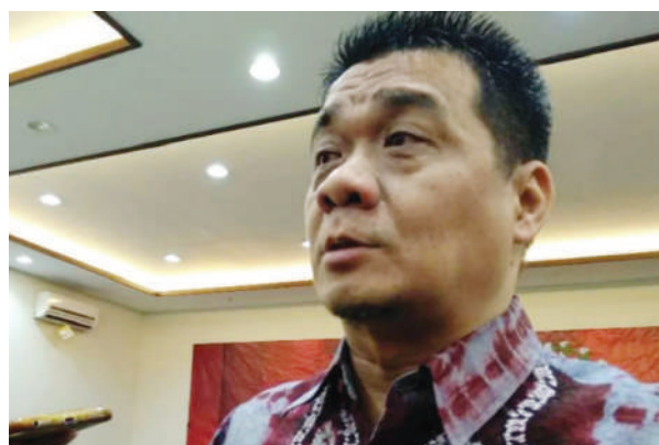
Wagub DKI Jakarta Ahmad Riza Patria.