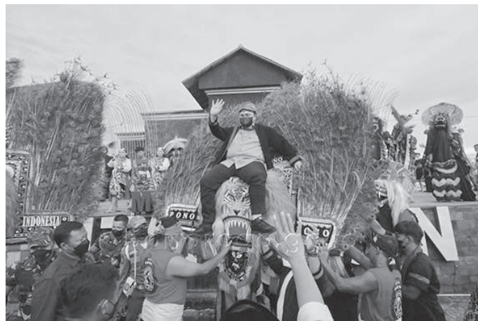
Menteri BUMN Erick Thohir saat menaiki salah satu reog

dampak wisata berbasis budaya yang berdampak luar biasa," pungkasnya. (pnrg)