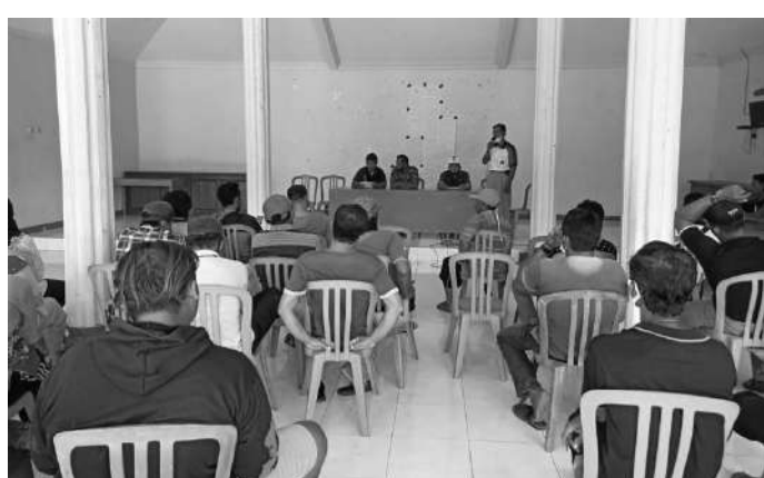
Suasana audiensi di balai Besa Bululawang