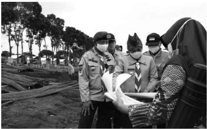
Gubernur Jawa Timur, Khofifah Indar Parawansa saat meninjau Hunian Sementara (Huntara) yang dibangun oleh Gerakan Pramuka Peduli

Lumajang, SMN - Gubernur Jawa Timur, Khofifah Indar Parawansa meresmikan Hunian Sementara (Huntara) yang dibangun oleh Gerakan Pramuka Peduli di tempat lokasi warga terdampak Erupsi Gunung Semeru, di Desa Sumbermujur, Kecamatan Candipuro Jum'at (11/2).