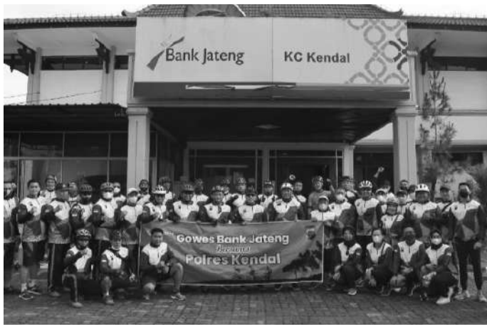
Acara Gowes bareng Bank Jateng

Kendal, SMN - Mengambil start dari Kantor Cabang Bank Jateng di Jalan Soekarno-Hatta Kendal, rombongan yang terdiri dari Kapolres Kendal dan Kepala Bank Jateng Cabang Kendal, dalam kegiatan gowes bareng, Jumat (11/2/2022).