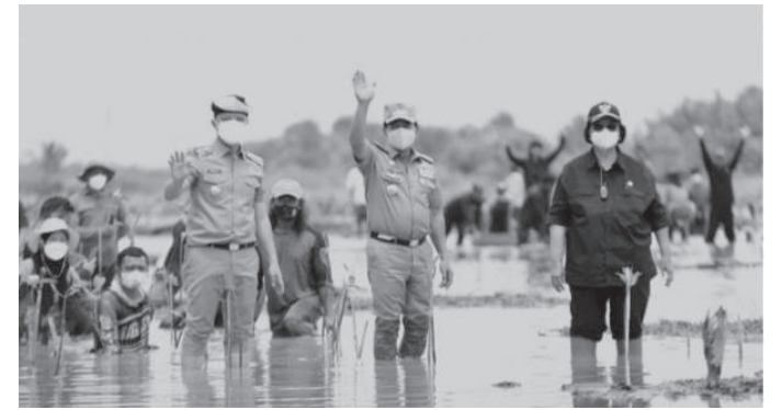
Gubernur Kaltara, Zainal Arifin Paliwang dan Bupati Tana Tidung, Ibrahim Ali bersama Menteri Lingkungan Hidup dan Kehutanan, Siti Nurbaya saat melakukan penanaman mangrove di Desa Bebatu, Kabupaten Tana Tidung

"Target kita dalam tiga tahun ke depan agar kita perbaiki. Sebab Indonesia memiliki luas hutan mangrove yang terbesar di dunia," tuntasnya. (dkispkaltara)