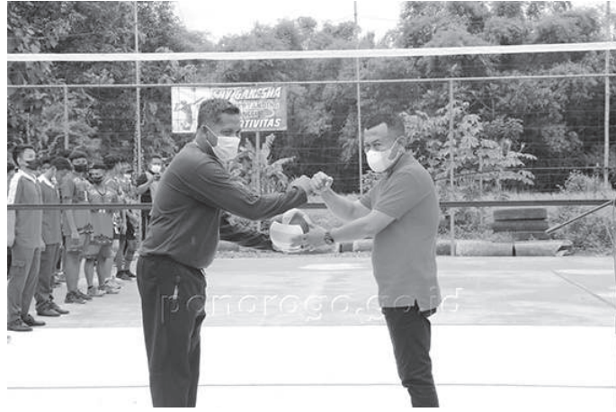
Kang Bupati Sugiri saat membuka Turnamen Bola Voli Piala Bupati Ponorogo Tingkat Pelajar SMP dan SMA Se-Kabupaten Ponorogo

"Ponorogo ini tambangnya atlet voli yang bagus-bagus di masa lalu. Saya sebut nama Mas Jalu yang merupakan pemain nasional, itu dari Ponorogo. Dan kehadiran kami dalam pembukaan turnamen ini adalah bukti kecintaan terhadap olahraga dan khususnya voli ini," ujarnya.