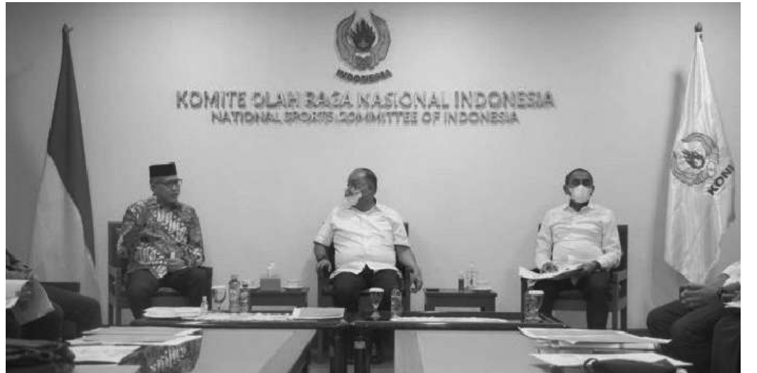
Gubernur Aceh Nova Iriansyah, menyambut baik ditunjukkannya Aceh sebagai tempat pembukaan Pekan Olahraga Nasional (PON) XXI tahun 2024

Banda Aceh, SMN - Gubernur Aceh Nova Iriansyah, menyambut baik ditunjukkannya Aceh sebagai tempat pembukaan Pekan Olahraga Nasional (PON) XXI tahun 2024 oleh Komite Olahraga Nasional Indonesia (KONI) Pusat.