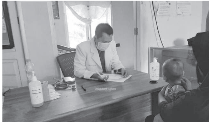
Layanan dokter terbang di Desa Sekaduyan Taka, Kecamatan Sei Menggaris, Nunukan

"Jadi kita akan sesuaikan dengan kondisi dan kebutu-