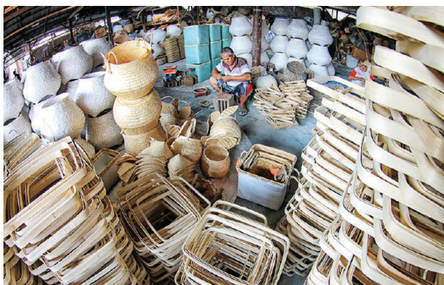
Penguatan dan pemulihan Usaha Ultra Mikro menjadi cerminan dari kebangkitan ekonomi Indonesia yang menjadi presidensi G20 pada tahun ini.

Denpasar, SMN - Jumlah usaha mikro yang mencapai 98,7 persen dari UMKM di Indonesia telah menjadi tulang punggung perekonomian nasional. Pasalnya sektor usaha mikro berkontribusi terhadap penyerapan 109,84 juta tenaga kerja atau 89,04% dari total tenaga kerja dan menyumbang 37,35% dari PDB Tahun 2019 (berdasarkan data Kemenkop & UKM, 2019).