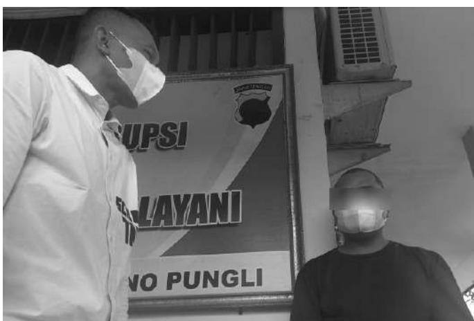
Tersangka pencabulan telah dimasukkan dalam sel Polres Rembang

Rembang, SMN - Satrikris Polres Rembang telah menetapkan MS sebagai tersangka dugaan pencabulan bocah di bawah umur di Lasem baru-baru ini. Hasil pemeriksaan penyidik, predator dari