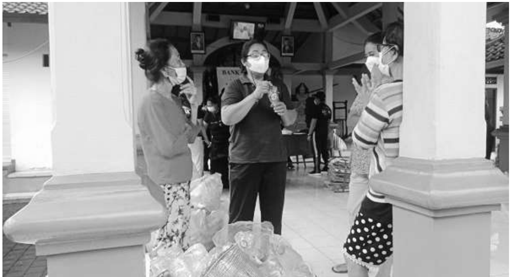
Resmi didirikan Bank Sampah Kayumas Kelod Bersemi di Banjar Kayumas Kelod, Kelurahan Dandin Puri

Bali, SMN - Silih berganti Bank Sampah terus berdiri Kota Denpasar. Kali ini, atas inisiatif PKK setempat, secara resmi didirikan Bank Sampah Kayumas Kelod Bersemi di Banjar Kayumas Kelod, Kelurahan Dandin Puri, Sabtu (5/3).