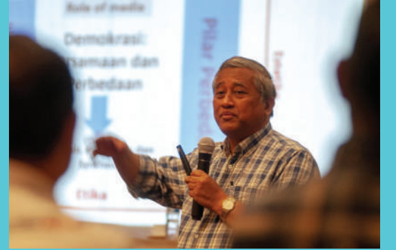
Ketua Dewan Pers Muhammad Nuh.

Jakarta, SMN - Ketua Dewan Pers, Muhammad Nuh mengingatkan insan pers dan industri pers untuk selalu mengikuti perkembangan teknologi. Menurutnya, saat ini perubahan paling cepat dalam kehidupan adalah perkembangan teknologi, baru disusul perubahan bisnis, kemudian