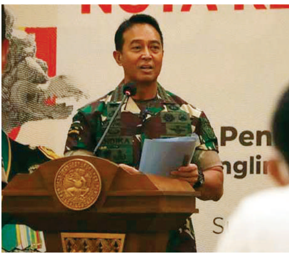
Panglima TNI Jenderal Andika Perkasa saat menyampaikan sambutan dalam penandatanganan nota kesepahaman (MoU) di Ruang Amerta, Lantai 4, Kampus C UNAIR.

Jakarta, SMN - Panglima TNI Jenderal Andika Perkasa mendorong prajurit dan pegawai aparat sipil negara (ASN) di lingkungan Tentara Nasional Indonesia untuk mengambil pendidikan dokter spesialis. Menurut Andika, TNI juga perlu menambah jumlah dokter spesialisnya karena kondisi saat ini Indonesia kekurangan dokter spesialis.