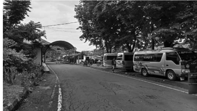
Suasana Terminal Pandaan yang nampak sepi

Pasuruan, SMN - Dinas Perhubungan (Dishub) Kabupaten Pasuruan menyiapkan strategi terhadap trayek yang ada di daerahnya. Tujuannya untuk menghidupkan kembali trayek yang sepi dilalui MPU, seperti dari pantauan media ini, yang secara langsung terjun ke lapangan melihat keadaan terminal MPU di Pandaan.