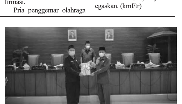
DPRD Nganjuk serahkan hasil reses kepada Bupati Nganjuk dalam Rapat Paripurna Perdana di Tahun 2022

Tatit juga menambahkan bahwa hasil reses sudah sinkron dengan hasil Musrenbang baik tingkat Desa dan Kecamatan. "Hasilnya sebagian sudah sinkron dengan hasil Musrenbang baik tingkat Desa maupun Kecamatan, sebagian lagi sudah sesuai dengan