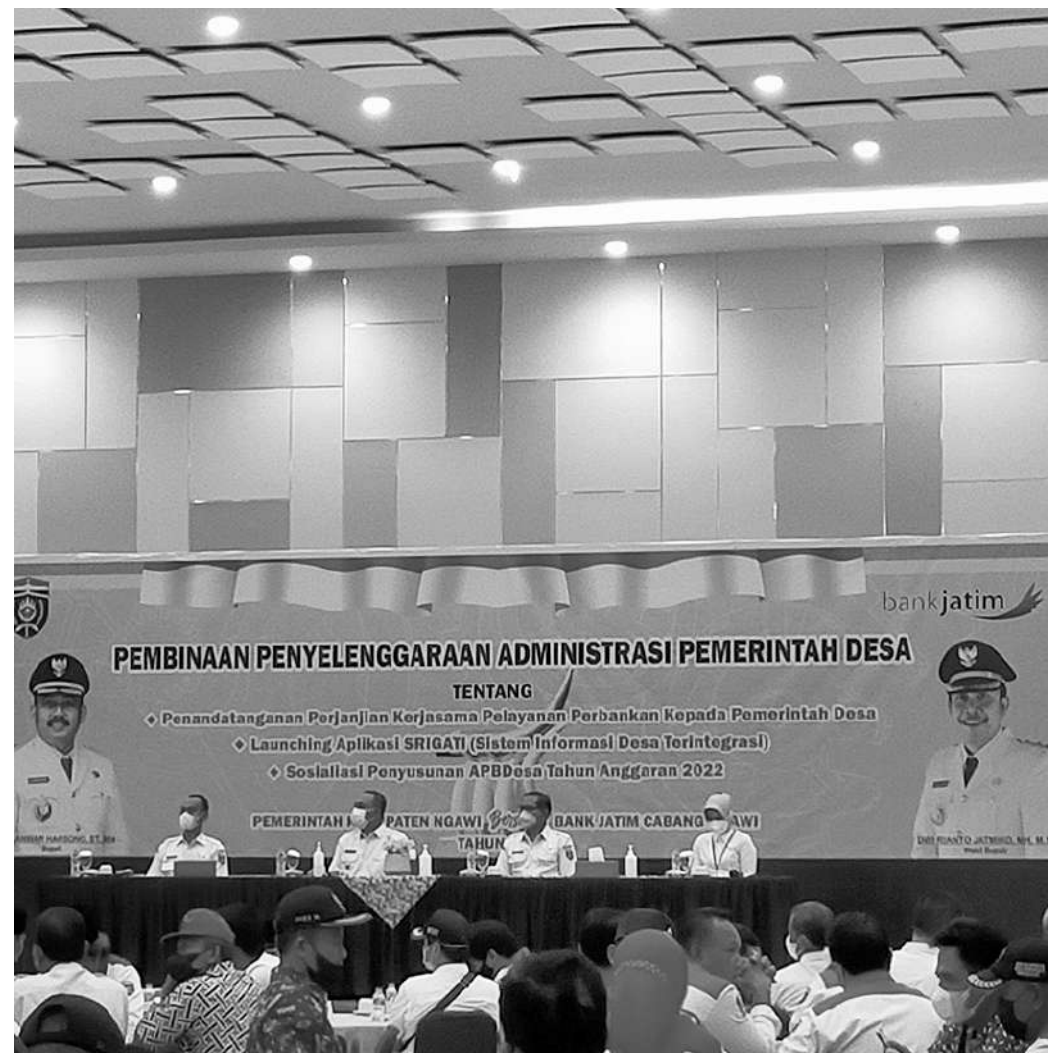
Aplikasi Srigati diharapkan jadi solusi cepat dan efisien, bagi warga Ngawi dalam mengakses pelayanan publik

Kuncoro. Aplikasi Srigati sendiri, menggunakan sistem open source, dimana aplikasi ini merupakan pengembangan dari sistem yang sudah ada dengan domain ngawi.id. Dari sistem open source ini, dapat dikembangkan berbagai menu, mulai dari data pelayanan sampai dengan pendataan Sistem Keuangan Desa (Siskeudes). Aplikasi Srigati akan mengembangkan berbagai teborosan layanan untuk masyarakat. Hal itu misalnya pada administratif pendataan hingga mampu memetakan daerah yang perlu bantuan. (Adv/Dinas Kominfo/ari)