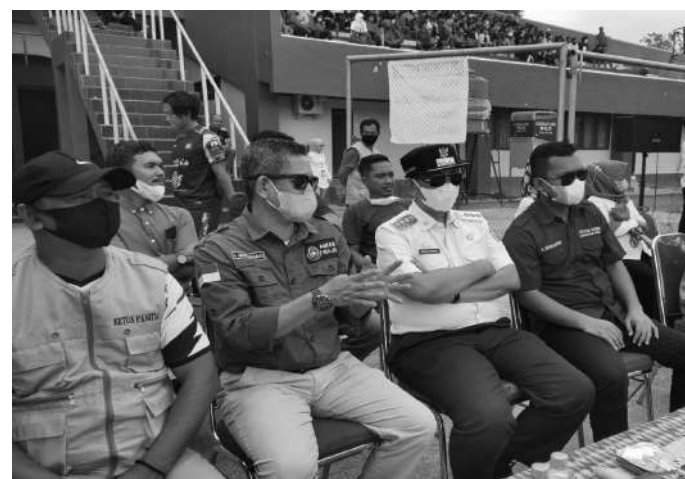
Bupati Wajo beserta Ketua Gaswa sekaligus anggota DPRD Wajo membuka turnamen sepak bola Cup Wajo

Amran berharap turnamen Gaswa Wajo ini terus berlanjut untuk kembali mengembalikan