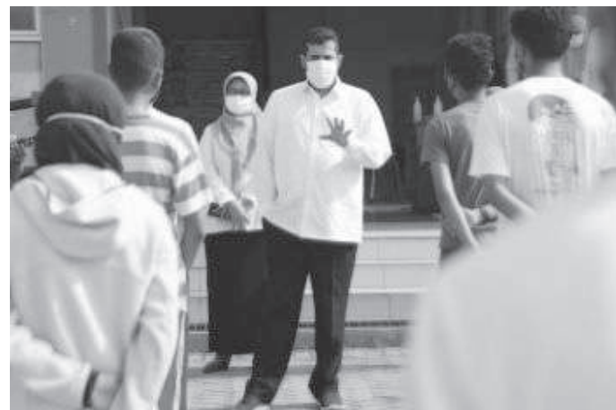
Wali Kota Hadi Zainal Abidin saat berikan Motivasi

Wali Kota Hadi mengimbau masyarakat untuk tetap mematuhi protokol kesehatan, karena wabah pandemi belum terakhir. "Jangan sampai kita