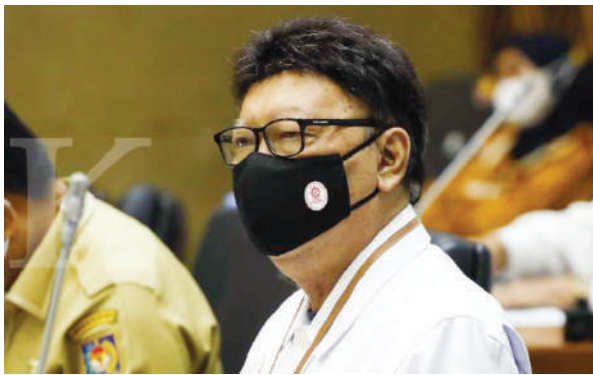
ILUSTRASI. Menteri PANRB Tjahjo Kumolo menerbitkan surat edaran pemanfaatan gedung pelatihan pemerintah jadi fasilitas isolasi.