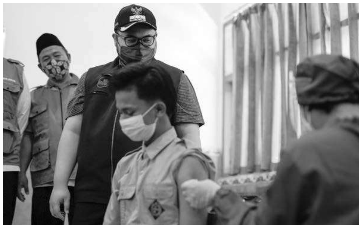
Bupati Kediri Hanindhito Himawan Pramana saat melakukan peninjauan vaksinasi massal di MAN 1 Kediri

Hal tersebut jadi salah satu kolaborasi yang sangat baik antara Kabupaten Kediri dengan Polresta Kediri guna kepentingan masyarakat. (kominfo/adv/kan)