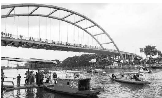
Sungai Siak, Pekanbaru Riau

Pekanbaru, SMN - Pemerintah Kota Pekanbaru, Riau menata kawasan kumuh di pinggir Sungai Siak untuk dijadikan sebagai lokasi wisata dan pusat kuliner untuk menarik kunjungan warga.