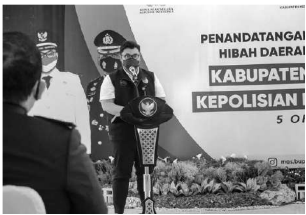
Bupati Kediri Hanindhito Himawan Pramana saat memberikan sambutan

“Jangan sampai kita sudah meningkatkan tracing, masyarakatnya tetap kendur karena terbawa euforia turunnya PPKM,” pungkas Mas Bup. (Kominfo/adv/kan)