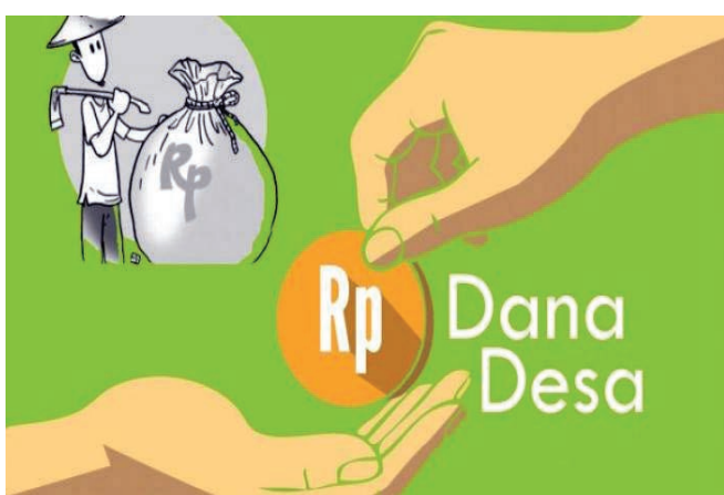
Ilustrasi Penyaluran dana desa