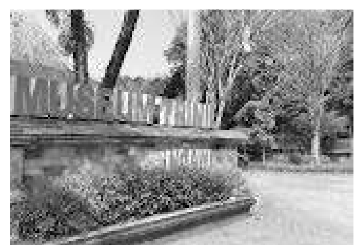
Museum Trinil di Desa Kawu, Kecamatan Kedunggalar, perlu dikenal oleh generasi muda

"Upaya mengenalkan museum pun kita lakukan dengan cara yang berbeda. Ke depan