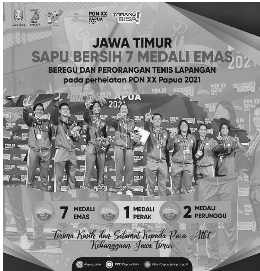
Provinsi Jatim sukses sapu bersih 7 Medali Emas beregu dan perorangan Tenis Lapangan pada perhelatan PON XX Papua 2021

Tak hanya itu, prestasi lainnya yang ditorehkan. Provinsi Jatim sukses meraih medali emas cabang olahraga (cabor) Emas cabor Wushu PON XX Papua 2021. Pertandingan cabor Catur PON XX Papua 2021 digelar di Ho-