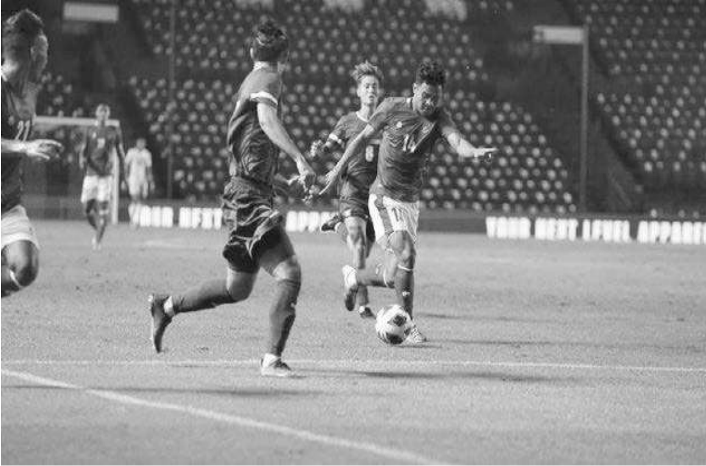
Timnas Indonesia menang 2-1 atas Taiwan

Jakarta, SMN - Timnas Indonesia berhasil mengalahkan Taiwan dengan skor 2-1 pada leg pertama playoff Kualifikasi Piala Asia 2023 di Buriram, Thailand, Kamis (7/10).