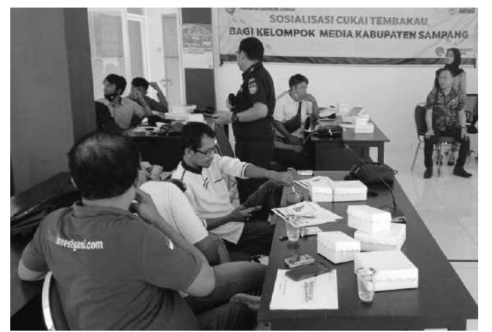
Sosialisasi Pemerintah Kabupaten Sampang Berama Pers Untuk Menyadarkan Masyarakat Kabupaten Sampang Bahayanya Rokok Ilegal

Dengan menggelar sosialisasi ketentuan di bidang cukai, Kamis, (23/09) lalu, insan pers diharapkan membantu pemerintah untuk memberantas rokok tanpa cukai tersebut. Sosialisasi digelar di aula Diskominfo dengan melibatkan insan pers dengan tujuan agar insan pers bisa memberikan pemahaman dan edukasi kepada masyarakat tentang apa yang dimaksud cukai rokok dan rokok ilegal serta bahayanya. ini sebagai bekal pemahaman tentang rokok ilegal dan bahayanya supaya nantinya bisa di sosialisasikan kepada masyarakat dan dapat menyadarkan masyarakat tentang bahaya rokok ilegal. Kami melakukan kegiatan ini supaya para insan pers dapat menyampaikan atau mengedukasi kepada masyarakat tentang cukai rokok ilegal, sehingga masyarakat bisa memahami dan ikut