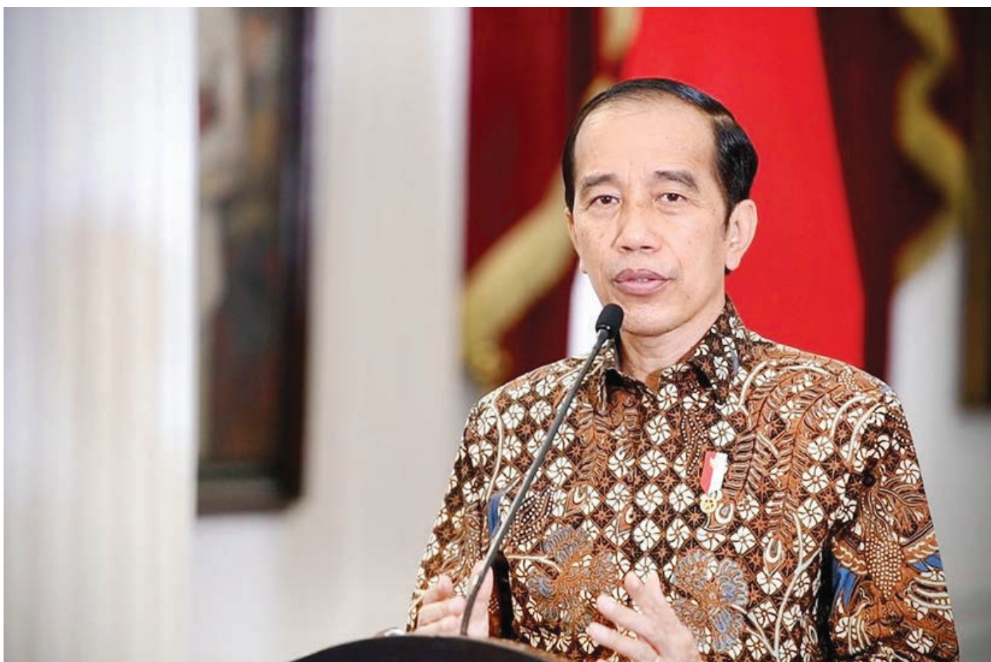
Menko Polhukam Mahfud MD menyebut Presiden Jokowi telah mengeluarkan keputusan presiden (Keppres) terbaru guna membekali Satgas BLBI memburu aset negara.

Adapun personel tambahannya antara lain, Menteri ATR/BPN Sofyan Djalil di jajaran Pengarah dan Kabareskrim Polri Komjen Pol Agus Andrianto di jajaran Pelaksana