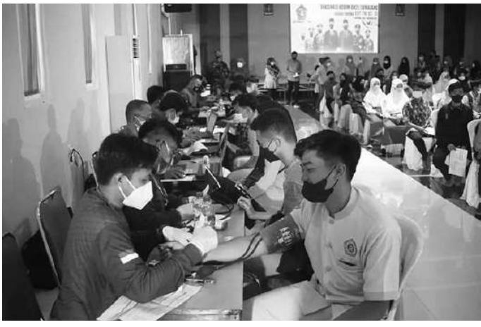
pelaksanaan serbuan vaksinasi yang dilaksanakan di SMK Muhammadiyah Lumajang.

Lumajang, SMN - Bupati Lumajang, Thoriqul Haq mengapresiasi atas pelaksanaan serbuan vaksinasi yang dilaksanakan di SMK Muhammadiyah Lumajang. Ada banyak masyarakat dan pelajar SMK Muhammadiyah yang ikut vaksin pertama atau kedua. "Masyarakat sangat antusias, saya melihat masyarakat sekarang sudah sadar dan mengerti tentang vaksin. Karena