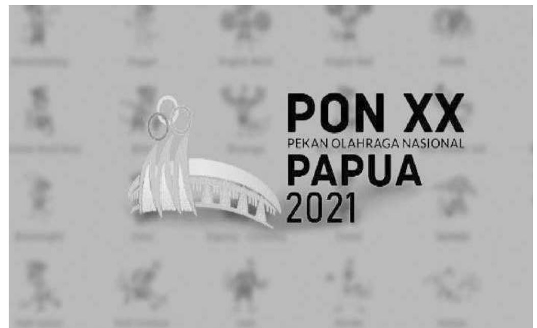
Logo Pon Papua

Jabar selaku juara bertahan, misalnya, mengandalkan cabang olahraga dayung sebagai salah satu lumbung emas, selain menembak, taekwondo dan renang yang be-