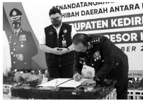
Penandatanganan serah terima sertifikat tanah milik Pemda kepada Polres Kediri Kota