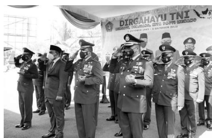
Upacara Peringatan HUT TNI ke-76 diikuti jajaran Forkompimda Ngawi secara virtual