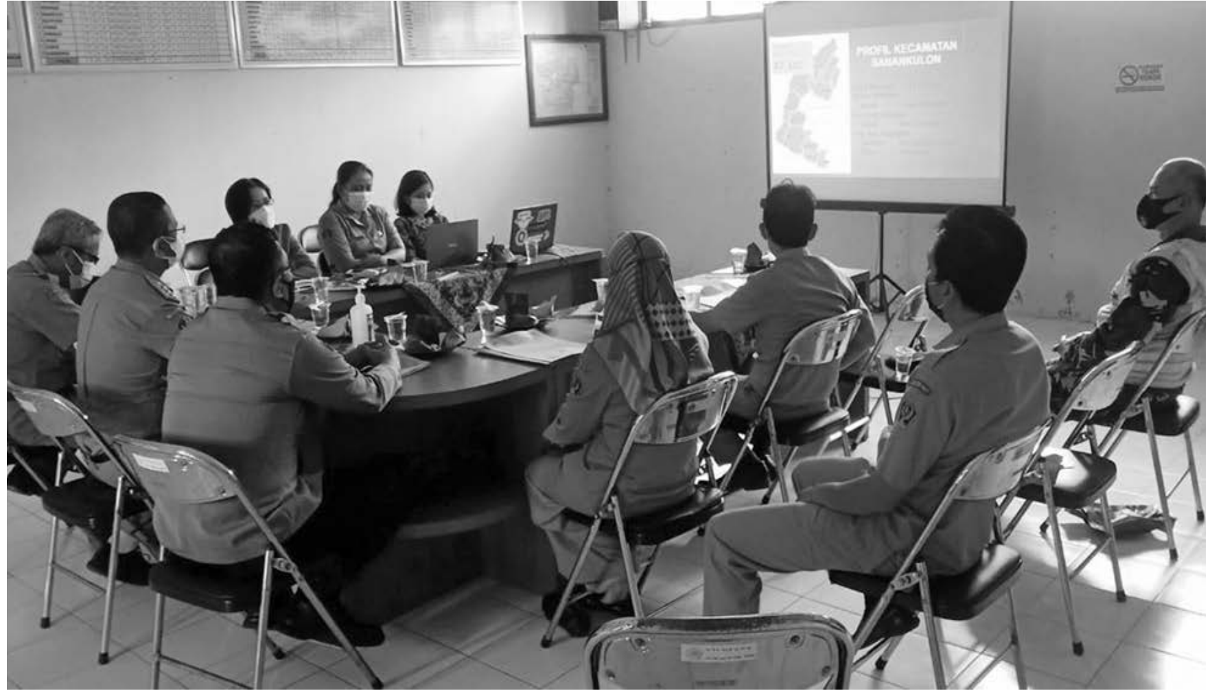
Tim percepatan penanggulangan covid-19 dan vaksinasi Kecamatan Sanankulon

Meskipun begitu, pihaknya juga tetap berupaya untuk mengajukan ke provinsi untuk ketersediaan vaksin jenis sinovac. Kemudian untuk jenis vaksin yang lain tetap dimanfaatkan kepada daerah mana yang menerima jenis vaksin tersebut. (mam/adv/kmf)