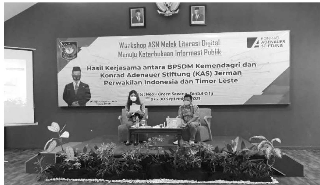
Acara Workshop Aparatur Sipil Negara (ASN) dengan tema "ASN Melek Literasi Digital Menuju Keterbukaan Informasi Publik"

Lebih lanjut Ia juga menyampaikan agar kedepan peran SDM Aparatur dalam menghadapi keterbukaan informasi mampu memperkuat SDM aparatur, memberikan informasi penerangan, dan pendidikan kepada masyarakat tentang kebijakan, aktivitas, dan langkah pemerintah secara terbuka, transparan, jujur dan objektif hingga