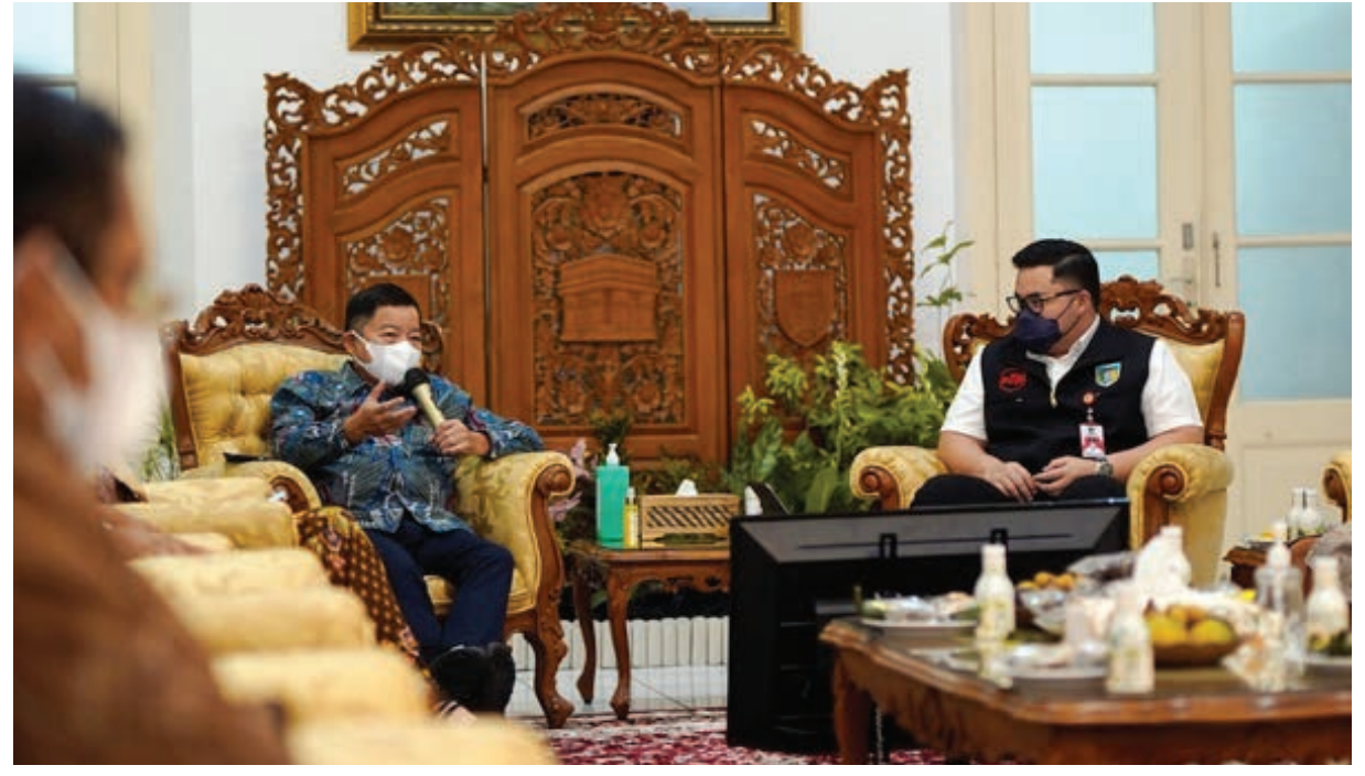
Menteri PPN/Kepala Bappenas, Suharso Monoarfa saat memberikan sambutan

Materi lainnya juga disampaikan terkait pengertian pita cukai, “Pita Cukai adalah dokumen sekuriti sebagai tanda pelunasan cukai dalam bentuk kertas yang memiliki sifat/unsur sekuriti dengan spesifikasi dan desain tertentu. Pita Cukai dilekatkan pada kemasan barang kena cukai. Pita Cukai akan berganti desain pada setiap tahun anggaran berikutnya. Pita Cukai dalam keseharian dikenal sebagai istilah BANDEROL” Pungkasnya. (kominfo/adv/sl)