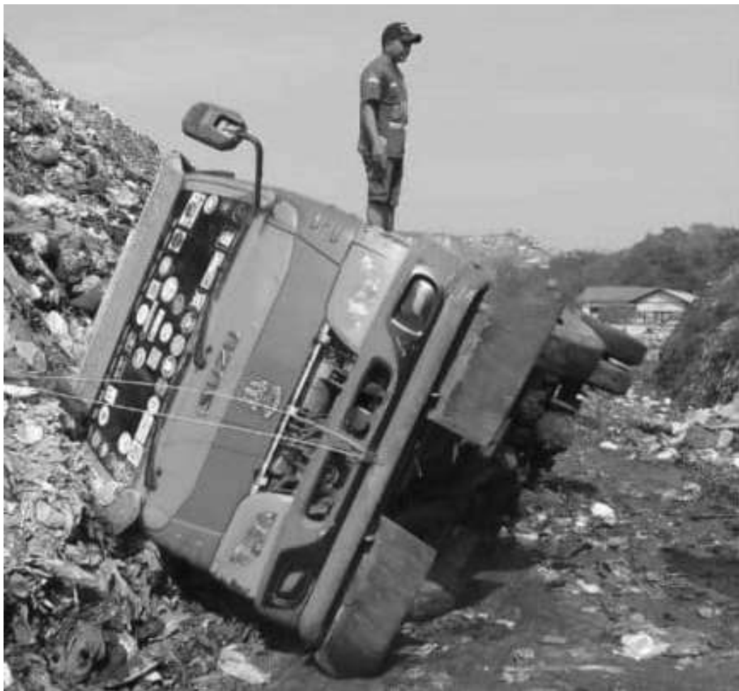
Salah satu truk yang mengalami insiden kecelakaan

Kota Bekasi, SMN - Momok menakutkan dan mengganggikan terlihat di setiap raut wajah para sopir armada DLH (Dinas Lingkungan Hidup) Kota Bekasi Jawa Barat disaat akan melintasi jalur jalan dalam zona Tpst Sumur Batu menuju lokasi titik pelayanan pengangkutan sampah dengan alat berat Eksapator. Peralnya, sepanjang pintu masuk gerbang Tpst Sumur Batu tampak terlihat jalan masuk sampai pada titik akhir jalan di dalam zona sudah tidak layak lintas roda empat lagi karena rusak parah hancur dan berlubang belum lagi di tambah genangan air serta sampah yang semeraut tak tertata tampak membuat