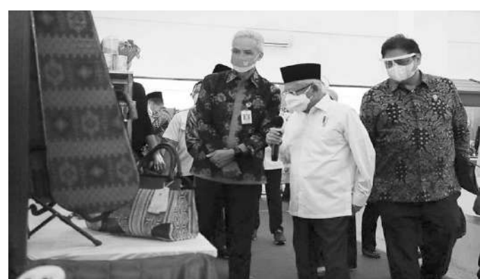
Wakil Presiden Ma'ruf Amin didampingi Gubernur Jateng Ganjar Pranowo di Gedung Gradhika Bhakti Praja Kota Semarang

Ma'ruf menyebut dari seluruh Indonesia, setidaknya ada 212 kabupaten yang menjadi target penanggulangan kemiskinan ekstrem hingga tahun 2024. Percepatan dilakukan mulai 2021 dengan target sasaran 35 kabupaten di tujuh provinsi. "Dari pertemuan ini kita harapkan adanya sinkronisasi penangan baik anggaran dari pusat, provinsi maupun dari kabupaten. Ditambah lagi mungkin dari CSR dari juga filantropi termasuk Baznas, kemudian kita bisa selesaikan lima kabupaten di Jawa Tengah," kata Ma'ruf da-