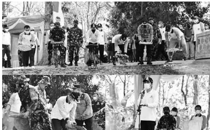
Bupati Madiun H. Ahmad Dawami, Wakil Bupati Madiun H. Hari Wuryanto, Dinas PMD Kabupaten Madiun, Kodim 0803 Madiun dan jajaran forkopinda Kabupaten Madiun mengikuti kegiatan TMMD di Desa Bodag Kecamatan Kare Kabupaten Madiun

Pembangunan jalan tersebut berupa pengaspalan sepanjang 2000 meter x 4 meter yang menghubungkan Dusun Glagah Ombo