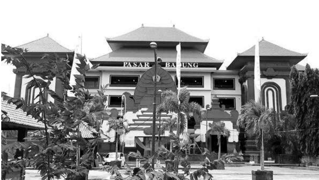
Pasar Badung Denpasar Bali

Denpasar, SMN - Pasar Badung Denpasar akan menjadi salah satu pasar dari 14 pasar yang diujicobakan penerapan aplikasi PeduliLindungi. Dengan demikian Pasar Badung menjadi satu-satunya pasar yang akan melakukan uji coba aplikasi PeduliLindungi di Bali.