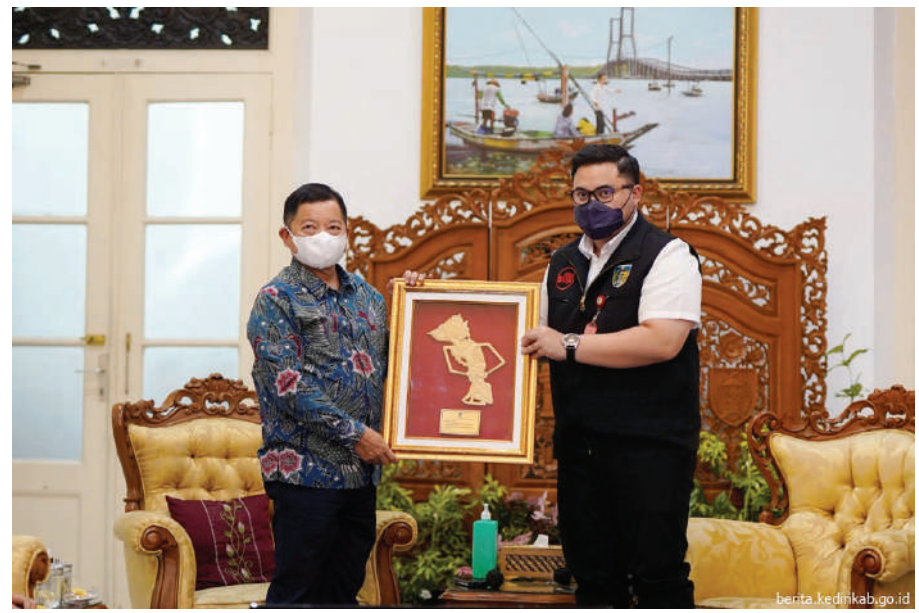
Bupati Kediri Hanindhito Himawan Pramana menyambut Menteri Perencanaan Pembangunan Nasional Republik Indonesia (PPN RI) sekaligus Kepala Bappenas, Suharso Monoarfa

Selain terkait pembangunan, Mas Bup menambahkan, Menteri PPN juga bertitip pesan terkait imunisasi serta pencegahan TBC. “Melihat tren Covid-19 yang sedang landai maka ini momentum untuk menggenjot imunisasi,” tutur Mas Bup. (Kominfo/adv/kan)