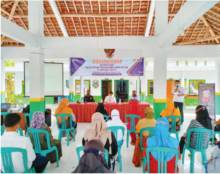
Dinas Komunikasi dan Informatika Kabupaten Jombang bekerjasama dengan Kantor Bea Cukai Kediri menggelar sosialisasi di desa Bawangan - Ploso - Jombang, Kamis (08/09/2021)

Jombang, SMN - Cukai Hasil Tembakau (CHT) alias cukai rokok memiliki peran penting bagi negara. Keberadaan cukai rokok dapat meningkatkan pendapatan pemerintah.