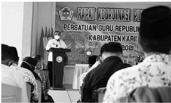
Rapat Koordinasi Pimpinan Persatuan Guru Republik Indonesia ( PGRI ) Kabupaten Karimun Tahun 2021

Menurutnya, bahwa memang saat ini Kabupaten Karimun mengalami kesulitan akibat dari pandemi covid-19, terlebih lagi Penda Karimun harus merefocusing anggaran yang jelas akan berdampak bagi tunjangan penghasilan pegawai, honorer insentif pegawai, kemudian belanja rutin di dinas-dinas dan juga menyentuh tentang kegiatan-kegiatan aspirasi yang diusulkan DPRD secara menyeluruh. (tbl)