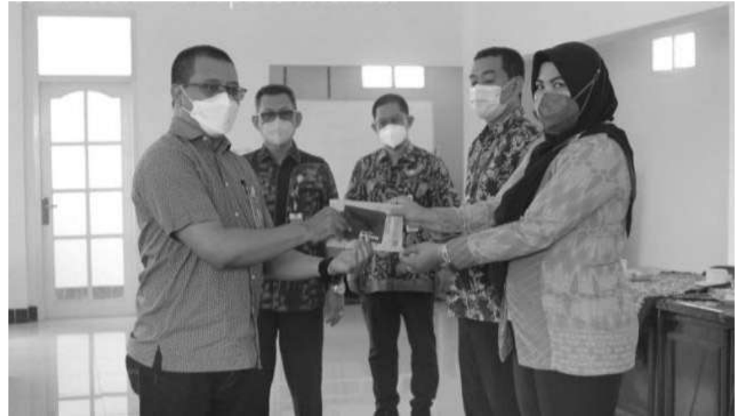
BPJS Ketenagakerjaan bersama Bank BRI menyerahkan Bantuan Subsidi Upah (BSU) bagi pegawai Non PNS/ASN dilingkup Setda Kendal

Kendal, SMN - Badan Penyelenggara Jaminan Sosial Ketenagakerjaan (BPJS TK) bersama Bank BRI menyerahkan Bantuan Subsidi Upah (BSU) bagi pegawai Non PNS/ASN dilingkup Setda Kendal, Kamis (7/10/2021).